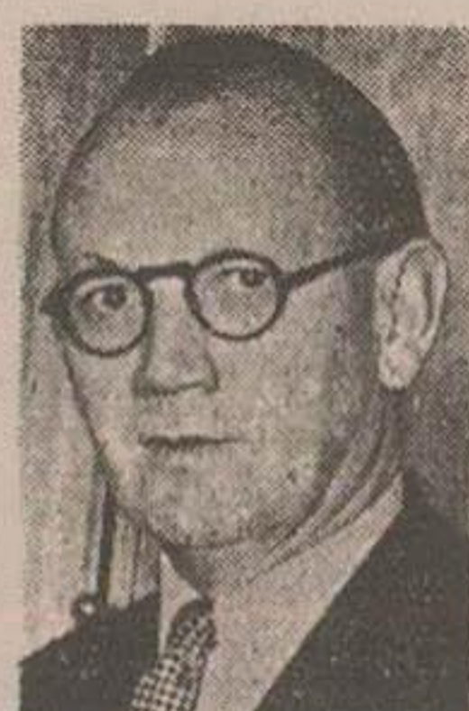
اظهارات آقای نو

دولت ایران باید معلوم کند از ۱۰ میلیون لیره برای مدت سه ماه تمدید شده بچه نحو استفاده خواهد کرد کنفرانس بغداد و کنفرانس کلمبو دارای وجه مشترکی است و بایکدیگر تشریک مساعی خواهند داشت