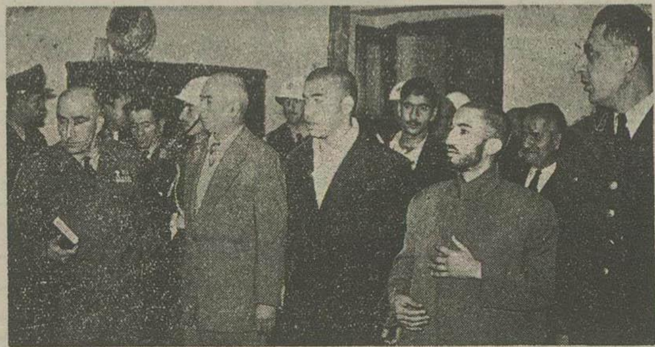
هنگام ورود رئیس دادگاه متعین و کلای مدافع آنها از جای برخاستند

و کیل طی باری گفت: نواب صفوی معارب و مفسد فی الارض میباشد