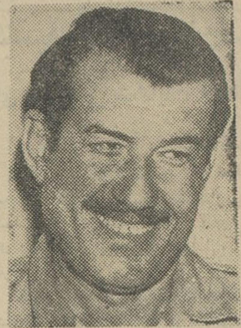
جلال اوقاتی فرمانده نیروی هوایی عراق

بغداد وضع عادی خود را از دست داده بود و در گوشه و کنار طرفین نیروهای خود را بسیج میکردند. کشتار با بازوبند هانی که روی مسلسل چهار سرباز طرفدار عارف شروع شد. آنها بمنزل جلال اوقاتی فرمانده نیروی هوایی عراق