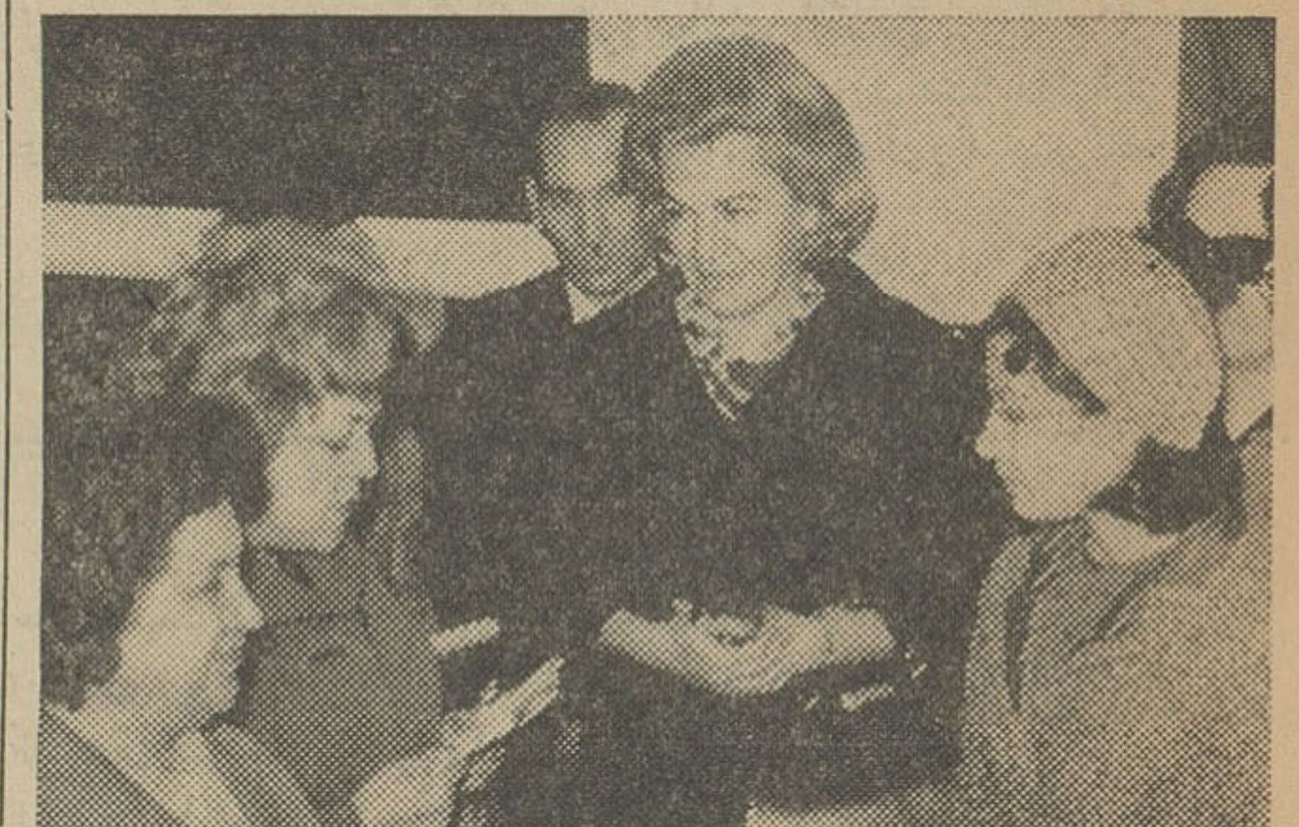
خانم نیر سعیدی آزادی زنان را بحضور والاحضرت شاهدخت اشرف پهلوی تبریک می گوید، سرکارعلیه خانم فریده دبیر نیز در کنار والاحضرت دیده می شوند.

بامداد امروز والاحضرت شاهدخت اشرف پهلوی ریاست عالیته شورای عالی جمعیت های زنان ایران از مسافرت مشهد باقطار به تهران باز گشتند. عده ای از شخصیت های مملکتی و نمایندگان جمعیت های مختلف زنان ایران برای استقبال از والاحضرت در ایستگاه راه آهن حضور یافته بودند.