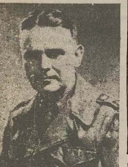
معاون ستاد ارتش آمریکا

معاون ستاد ارتش آمریکا تهران وارد خواهد شد