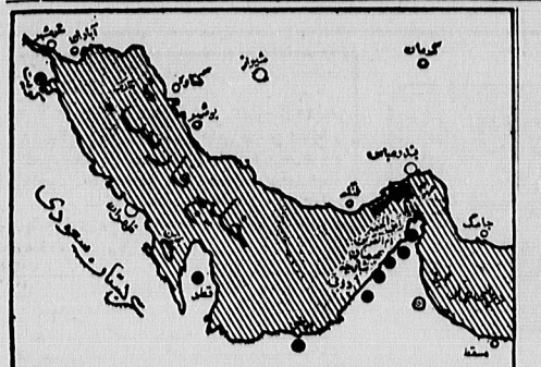
طرح عراق پیشنهادی از منطقه امن خلیج فارس و کشورهای همسایه آن.

طبق ماده (۵) این طرح، عربستان سعودی آماده است تا با کشورهای عربی منطقه و سایر کشورهای عرب با بکار بردن تمام امکانات در سرکوبی و مبارزه با «عوامل مغرب» در آن ممالک همکاری کند.