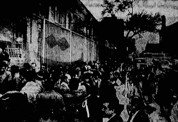
جدی پیش صنعتگران را دیدیم و تصور سازندهمان را دیدیم. اینها صف زواریه این صف را هم به آن هوش و خردی که در این کارخانه ها دیده شد. در حالی که این هیات اعرامی در تهران و سایر نقاط کشور به کفر متعهدان و غیر متعهدان تبدیل شده است.

کارخانه های ذوب روی و سرب تأسیس میشود. کارخانه های ذوب روی و سرب تأسیس میشود. کارخانه های ذوب روی و سرب تأسیس میشود.