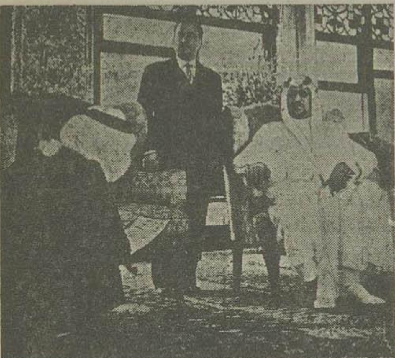
در چند روز اخیر مأمور دستگاه تلگراف صاحبقرانیه روزی دو بار بمسعود ملک سعود شرفیاب میشد و در حالیکه زانوی ادب بر زمین میزد کواو شات رسیده از جده را بر سر اعلیحضرت ملک سعود میزدند.

دیروز حرکت اعلیحضرت ملک سعود اعلامیه مشترک کی از طرف دولتین ایران و سعودی منتشر میشود