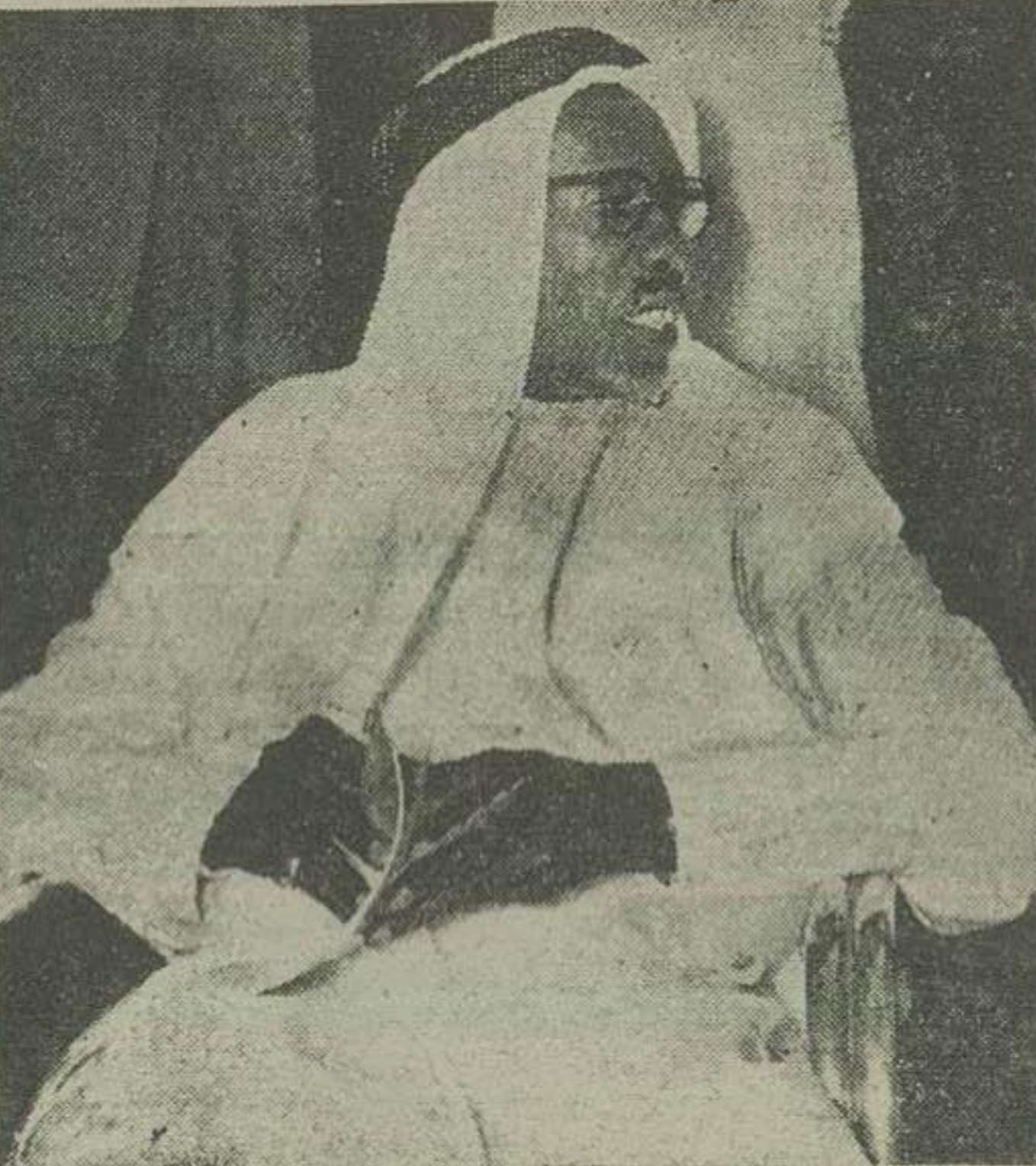
شیخ سرو و وزیر دارائی کشور سعودی مشغول توزیع هدایاست عزیمت وزیر دادگستری بخوزستان قرار اطلاع اعیان در علی امین وزیر دارائی کسری دو روز آینده حرم خوزستان میشود تا ادارات دادگستری سرگشایند

دیروز آخرین قسمت لایحه جدید مالیات بر درآمد منتشر شد و امروز غیرتکار مالی روزنامه درباره اجرای قانون واقداماتی که از طرف وزارت دارائی در این خصوص صورت گرفته اطلاعاتی کسب نموده که چون سائز اهمیت میباشد نکات اساسی آن برای اطلاع عموم درج میگردد. بر کناری مأمورین بد سابقه اولین دستوری که آقای فرزان کفیل وزارت دارائی بعد از تصویب بکار جدید مخصوصا در دوا مالی گاشته قانون جدید مالیات بر درآمد صادر