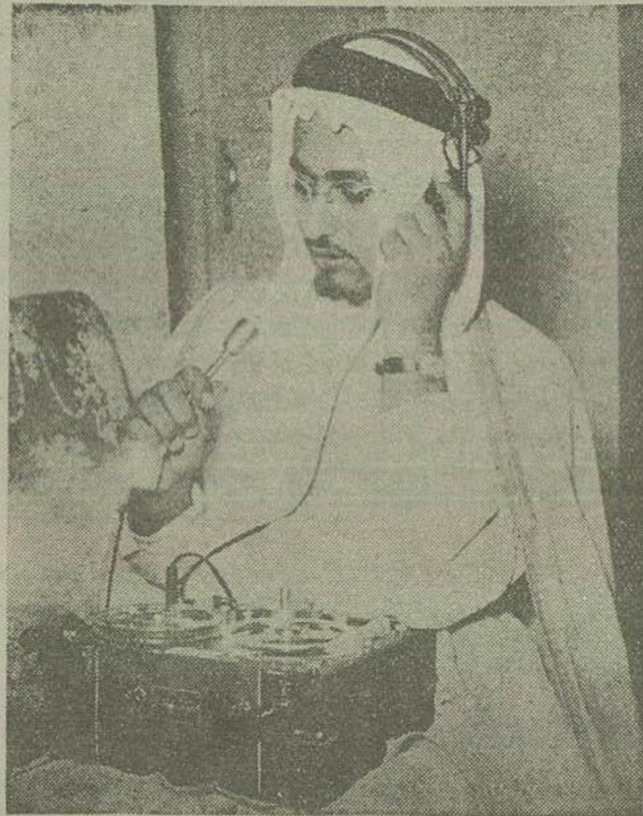
شیرنگار رادیو کشور سعودی همه جا پادشاه صمصدا مشغول تپه اخبار است

اعلیحضرت ملک سعود، مقارن ساعت نه پانصد امروز از امس عازم بایلس شدند و پس از ورود بایلس در قصر سلطنتی بابل با احترام برداشته و در وقت ظهر از اخبار و گزارشاتی که مرتباً بوسیله سیم از کشور هرستان سعودی بصاحبقرانیه مضایقه می شود، بوسیله یک مخصوص و وسایل مخابراتی باستحضار ملک سعود رسیده است و اعلیحضرت ضمن تماشای صاحبقرانیه دستوراتی در قبایل گزارشات واصله از کشور خود صادر فرمودند. اعلیحضرت ملک سعود، هنگام انعام دوروز از امس در بایلس نیز استفاده نمود. یامداد فردا اعلیحضرت ملک سعود با قطار مخصوص سلطنتی حاکم تهران خواهند شد تا در شبانی که فردا شب از طرف سفارت هرستان سعودی برپا میشود شرکت فرمایند.