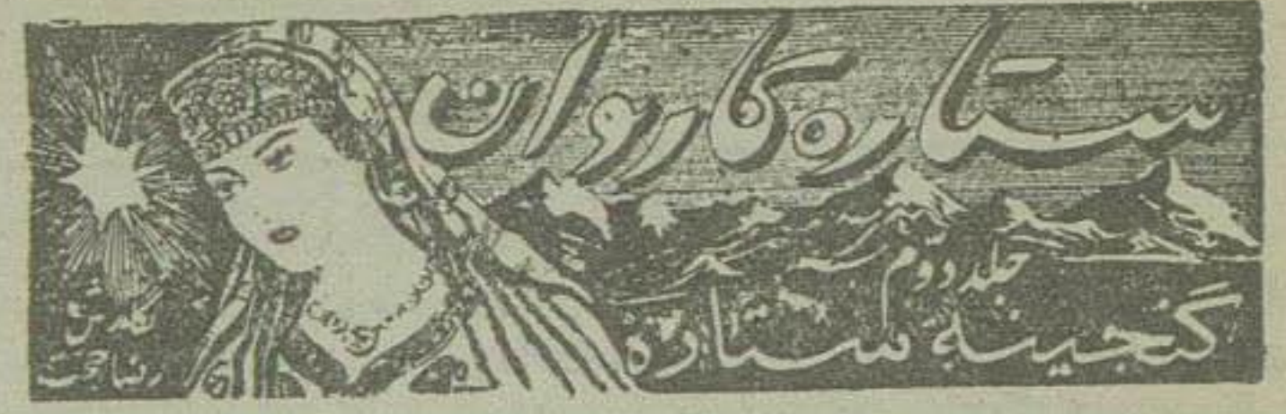
ساکهار کاروان کجیته مستاد