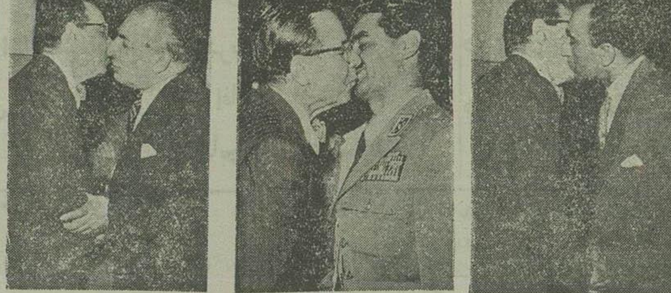
دو بوسی با وزیر کشور و دو بوسی با فرماندار نظامی

انتظام در فرود گاه بخبرنگار ما گفت: من برای سه هفته مرخصی از پیشگاه شاهنشاه اجازه کسب کرده ام و سعی خواهیم کرد پس از آن بهتر ان مراجعت کنم