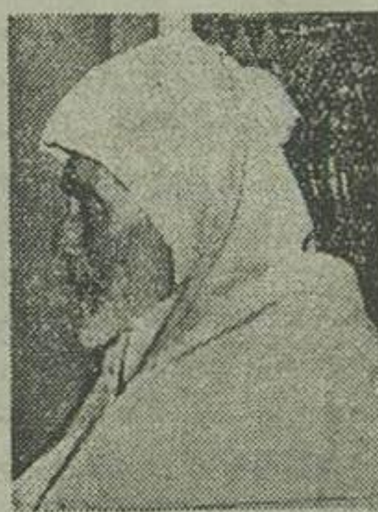
محمد بن عرفه جلوگیری از خونریزی از قرار معلوم زرنال بویه دولا تو و

برای جلوگیری از اظهارات و خونریزی از تفویض اختیارات سلطنتی بپسر او زاده سلطان سابق جلوگیری نکرده است. ضمناً از طرف میلیون مراکش نبود موقع خروج محمد بن عرفه از مراکش هیچگونه تظاهراتی صورت نگرفت. زرنال دولا تو و طی تظرفی که از راد بویه برادر کرد گفت سلطان مراکش بیل خودش این کشور را ترک کرده و کسی او را مجبور بانجام اینکار نساخته است. برادر زاده سلطان م. مراکش پنجاه سال دارد و اهل شهر فنز میباشد.