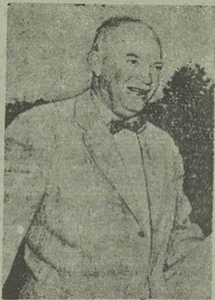
آخرین عکس آیزنهاور قبل از بیماری

دونر - رویتر - اعلامیه ساربه از طرف پزشکان معالج آیزنهاور حاکیست که وضع مزاجی این ناپلیدر همچنان رو به بهبودی میرود. بطوریکه بل اسکات ران کاین ممبر رویتر از واشنگتن خبر داده این حقیقت که شرمین آدامس مشاور پرزیدنت آیزنهاور بار دیگر شروع بکار کرده باوضع مهبی که پس از بروز بیماری رزیدنت آیزنهاور بوجود آمده بود با یان دادو نشان داد که رئیس جمهوری آمریکا که میکنتس هنوز هم آنطور که باید و شاید نتواند بکارهای رسیدگی کند ولی بهرحال تا آنجا که قادر باشد عمل و فصل امور دولتی خواهد پرداخت و دیشب قبل از اینکه بخواب برود دوستانه از اسناد مهم دولتی را امضاء کرد و این امر دو موضوع را روشن ساخت. یکی اینکه در نظر بیست اختیارات رئیس جمهوری برپادری نیکسون معاون رئیس جمهوری تفویض شود و دیگری آنکه بعضی از اسناد مهم که برای امضاء حاضر بوده بر اثر بیماری پرزیدنت آیزنهاور امضای آنها بتیوقت افتاده است.