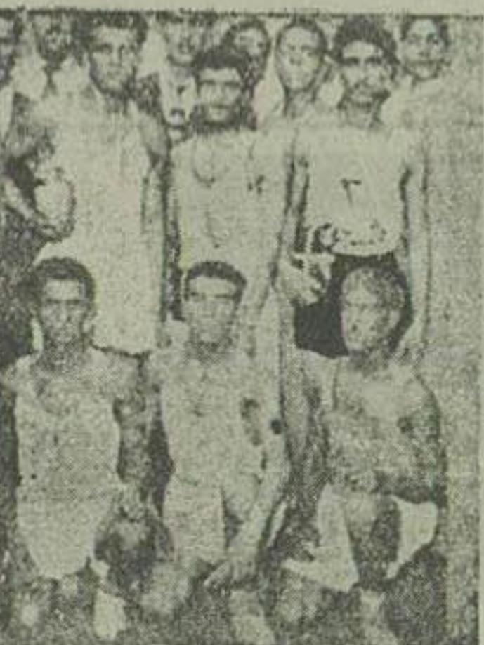
عکس بالا از برندگان این مسابقه برداشته شده است

شیوع آبله خبر نگار ما از نهباند تلگرافی گزارش می دهد: تا کنون ۱۶۱ نفر مبتلی به آبله دیده شده و ۳۰ طفل نیز بر اثر آن تلف شده اند.