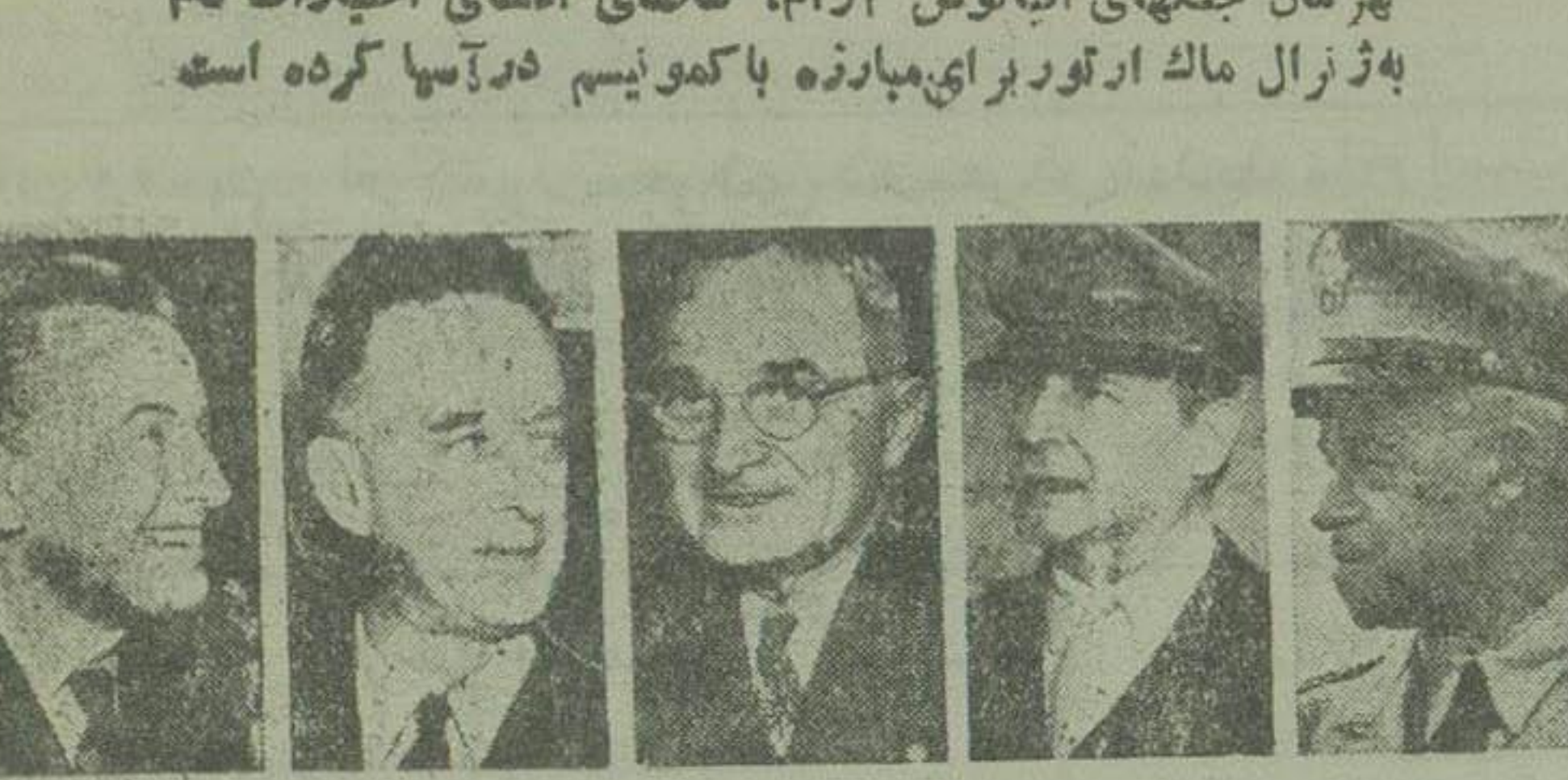
برادری، مک آرتور، ترومن، جیساپ، هریس

هر مان جنگهای اقیانوس آرام، تقاضای اعطای اختیارات تمام به ژنرال ماگ ارتور برای مبارزه با کمونیسم در آسیا کرده است