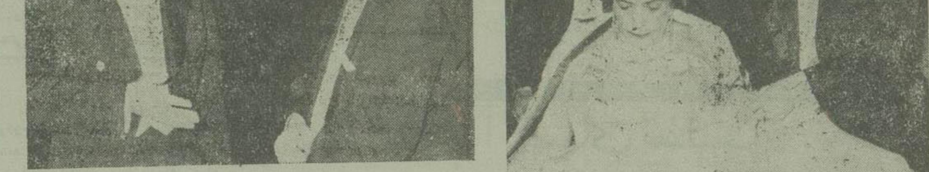
اعلیحضرت در مجلس عروسی مدتی باروای مجلسین سنا و شوروی صحبت میکردند.

دو اہم عروسی - شب جمعه تمام بعهده باغ قصر والا حضرت تهیه در صحنه پنجم