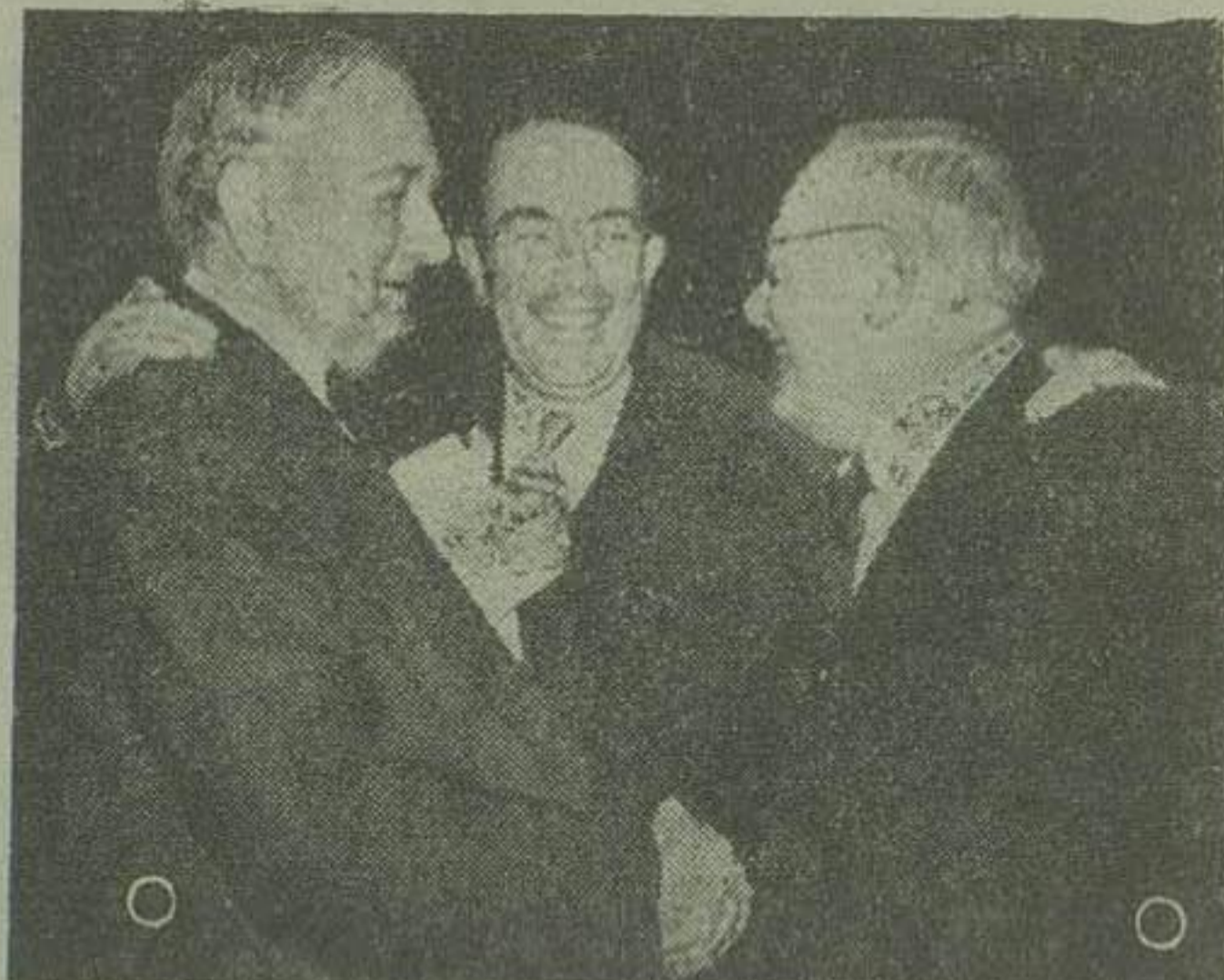
ویسینسکی وزیر امور خارجه شوروی چند روز قبل در حیاتی که در لیک ساکس برپا گردید با ساتور تام کتلی رئیس کمیته روابط خارج سنای امریکا و «سوارک» ملاقات و مدتی مشورتها مبادله نمودند.

لیک ساکس - جان فوستر دالس نماینده امریکا در مجمع عمومی ملل متحد در جلسه دیروز کمیته سیاسی مجمع ضمن قطع مفصلی که ایراد کرد اظهار داشت که عوم ملل عضو سازمان باستانه عده بسیار معدودی مایلند که صلح و آرامش جهان بطریق عملیتر و مطمئن تری تامین و تضمین گردد.