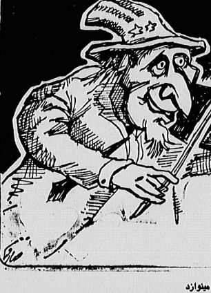
آمریکا برای ناتو ساز جنگ را میخواند

مهری در این صل را وزارت خارجه ایتالیا نیز تفسیر کرده. ایتالیا متحد یک کنفرانس مطبوعاتی در ناپل روی سرخه میزبانی فریب داد، کوبی میخواست ایتالیا را در آنچه اتفاق افتاده بود، مرگبرگ کند. ما بهر کسی میگوییم که ایتالیا متحد است ریکان را متقاعد سازند که او نمیتواند از افریقا در بزور تحصیل کند.