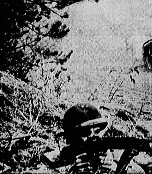
تجهیزات نظامی در عمان

اسرائیل، پس ما باید موافقت آنها و ابالات متحده را جلب کنیم. چرا که اولین اول ما باید ستاره در خشان را تکمیل کنیم. در نظر بگیریم و دوم موافقت طرفین را جلب کنیم. و او ششگانه نسبت به طرح فهد و اکتشامیت نشان داده است. آیا این امر تازمهای مصر را تکرار می کند؟