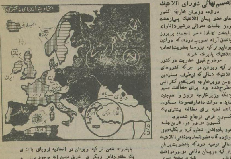
تصمیم نهائی شورای اتلانتیک دوازده وزیران خارجه کشور های عضو پیمان اتلانتیک پس از هشت روز جلسات متوالی در شهر اتاوا پایتخت کانادا، سر انجام پریروز با اتفاق آراء تصویب نموده که دولتی یونان و ترکیه نیز رسماً با عضویت اتحادیه اتلانتیک پذیرفته شوند

در آخرین جلسه شورای وزیران خارجه دوازده کشور عضو اتلانتیک شمالی ترکیه و یونان با تحادیه تدافعی اتلانتیک پذیرفته شدند