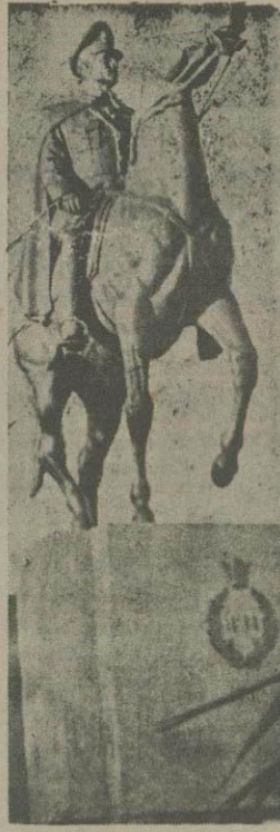
از روی این مجسمه پرده برداشته شد

جریان آموزشگاه پرستاری اشرف پهلوی چه بود؟