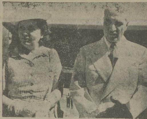
آقای «لوی هاندرسن» سفیر کبیر تازه امریکا در ایران که در انتصاب وی بایر مقام روز سه شنبه هفته گذشته از غرف مجلس سنا امریکا تصویب شد باطاق همسرش بند از ظهر امروز با هواپیمای وابسته نظامی سفارت وارد تهران گردید.

سفیر کبیر تازه امریکا در تهران که مدت سه سال سفارت کبیر امریکا را در هندوستان داشت ، قبل از حرکت از دهلی جدید برسم خددا حافظی بیانی خطاب بملت هند فرستاد و طی آن متذکر شد که کشورهای متحد امریکا دوست و غیر خواه ملت هند میباشند.