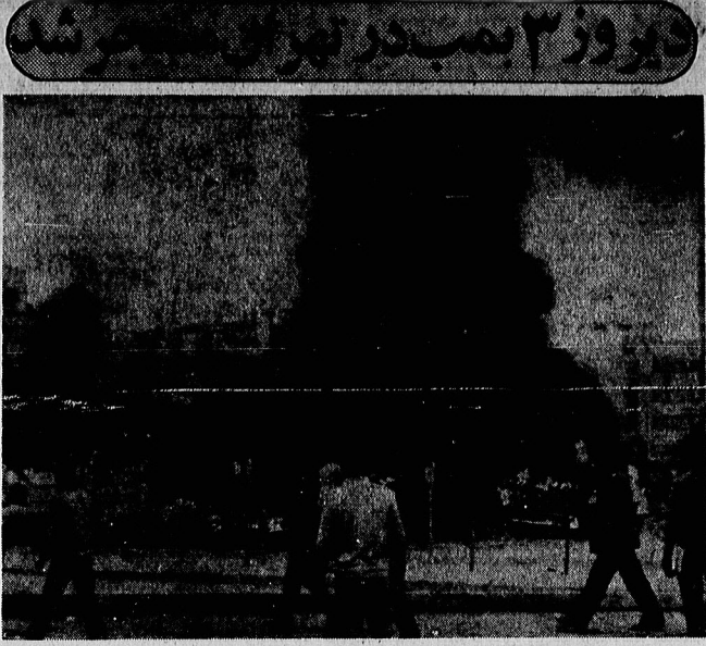
لحظاتی پس از انفجار بوم در پارکینگ شهرداری... اتومبیل هابر آتش می سوزد.

نماینده داستان گل انقلاب خدایران همسوزال تا اطلاع ثانوی پیکان نخ خرید قیمت اتومبیل پیکان ۴۵۰۶۰۰ ریال خواهد بود فرم درخواست اتومبیل پیکان که در جرایم چاپ خواهد شد، جای حواله را خواهد گرفت ۲ صفحه