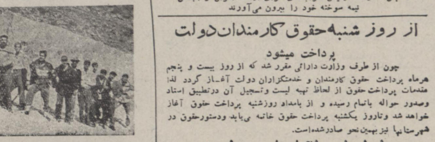
کوهنوردان در دامنه پربرف کرسی دیده میشوند

در مدت سه روز بقیه کرسی صعوده نمود و از غار نیاسر دیدن کردند