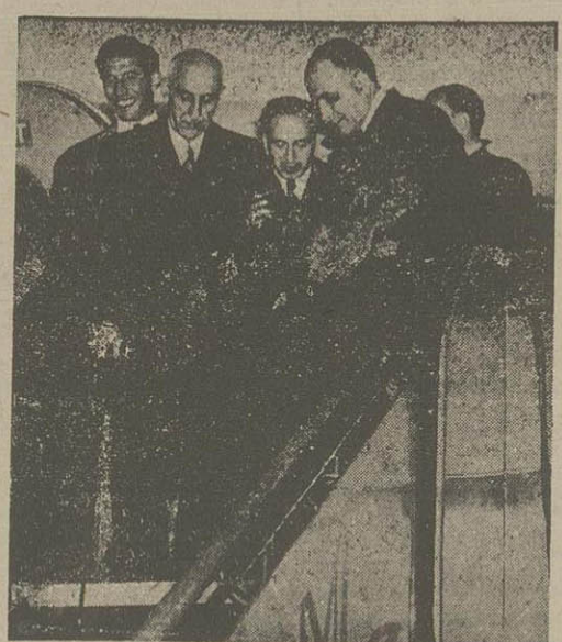
آقای دکتر مصدق نخست وزیر هنگام خروج از هواپیمای در حالی که آقای نواب وزیر مختار ایران در هلند و آقای دکتر غلامحسین مصدق درست جیب ایشان دیده میشوند