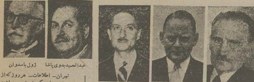
عبدالحمید بدوی پاشا زول یاسدان تهران - اطلاعات - هر روز که از توفیق هیئت نمایندگی ایران در لاهه میگذرد فعالیت نمایندگان ایران و قضات دادگاه بین المللی بیشتر میشود و این افزایش فعالیتها و دید و بازدیدها مثل آنست که با نزدیک شدن تاریخ تشکیل دادگاه لاهه نسبت مستقیم دارد. خبرنگاران خارجی که از نقاط مختلف هلند آمده اند در شهر لاهه دور تا دور هتل پالاس را محاصره کرده و با اسرار عجیبی از نمایندگان ایران هر کس و هر شخصی با ملاقات باقی مانده آورده و با اسرار زیاد مطالبی کسب کرده بدنیای خارج و روزنامه های خود مخابره میکنند.

نخست وزیر و وزیر خارجه هلند، ضمن تجدید از شخصیت دکتر مصدق گفتند: درباره دادگاه لاهه و مسئله نفت، مذاکره با نخست وزیر ایران نکرده اند. ملاقات نخست وزیر و وزیر خارجه هلند با دکتر مصدق و گفتگویی که در باره کمپانی نفت «شل» شده است از دیروز در محافل انگلیسی هلند، نسبت برآی دادگاه لاهه اظهار بدبینی و یاس و نگرانی شد. عبدالحمید بدوی پاشا قاضی مصری در دادگاه لاهه گفت: حضور دکتر مصدق در دادگاه، کمک بزرگی بنمایندگان ایران خواهد کرد با آمدن آقای انتظام به لاهه، هیئت نمایندگان ایران در دادگاه بین المللی تقویت شد نماینده شوروی از ملاقات خودداری کرد