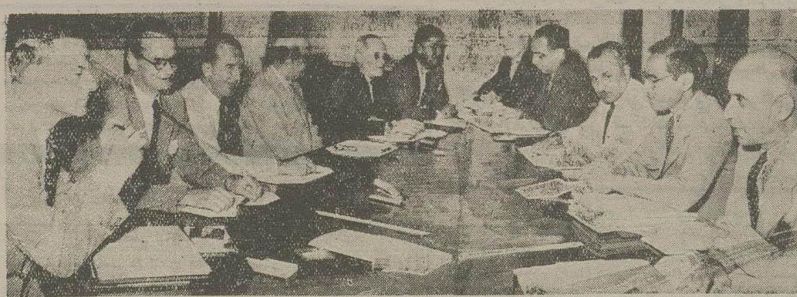
در عکس بالا دست راست اعضای هیئت نمایندگی ایران و سمت چپ اعضای هیئت نمایندگی کنفرانس عصر دیروز مشاهده میشوند

تشکیل شد. دکتر امینی رئیس هیئت نمایندگی ایران خطاب بنمایندگان کنفرانس گفت: امیدوارم که با توجه بانتظار ملت ایران و در محیط حسن تفاهم کامل مسائلی که مورد مذاکره است زودتر حل و به نتیجه مرضی طرفین برسد رئیس هیئت نمایندگی کنفرانس در جواب اظهار داشت: با توجه بانتظار ملت ایران و مشکلات موجود سعی خواهد شد راه حلی که مورد قبول طرفین باشد پیدا کنند اصل کلی پیشنهاد کنفرانس برای نمایندگان ایران تشریح شد میزان استخراج و تصفیه نفت در سال اول بین ۱ تا ۱ میلیون تن میباشد مذاکرات اولیه سه هفته بطور خواهد کشید و برای تنظیم قرارداد نیز یکماه وقت صرف خواهد شد