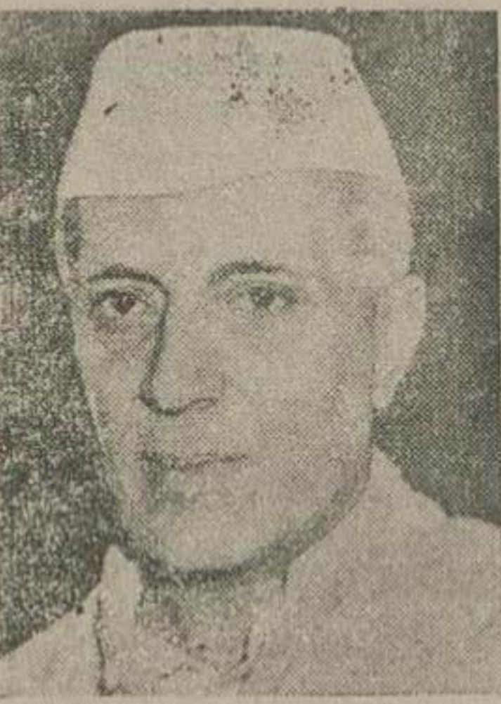
لیاقت علیخان نخست وزیر پاکستان