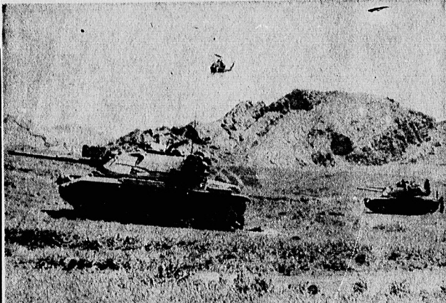
* نیروهای ارتش جمهوری اسلامی در مواضع مهم مرز ایران و عراق مستقر شده اند و با حمایت های کوبتزا در آمادگی کامل برای مقابله با دشمن بسر می برند.

توجه از ۱۳۵۹/۱/۲۷ برای اولین بار پارچه فروشی موناک هراج میگردد. موناک هراج چهار راه امیراکرم ۱۰۶۰۱۴