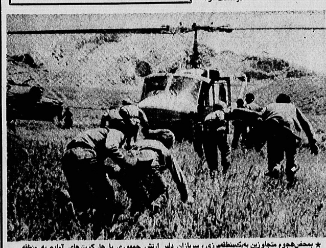
* بمب خور متجاوزین به منطقه مرزی، سربازان دلیر ارتش جمهوری با هلیکوپترهای آماده به منطقه میروند و تجاوز را سرکوب میکنند.

خبر نگاران اعزامی اطلاعات از منطقه باووسی گزارش میدهند نیروهای ایران بر اوضاع مسلط هستند