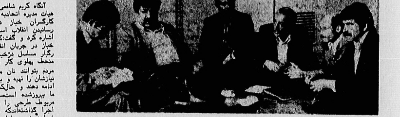
نمایندگان بیست هزار نانو اعلام کردند: طرح جدید نان کشاورزان را به شهر میکشاند

در جریان جلسه‌ای که به پیشنهاد طرح نان کشاورزان انجام شد، نمایندگان اعلام کردند که این طرح می‌تواند به بهبود شرایط نان‌سازان روستایی منتهی شود.