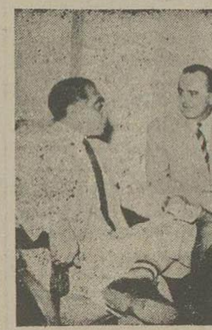
ظهر امروز آقای وزير مختار مجارستان و وابسته بازرگاني آن سفارت در تهران در وزارت اقتصاد ملي حضور يافته و در ملاقاتي كه با آقای دكتور اميني وزير اقتصاد ملي محل آمد مذاكراتي در خصوص قرارداد تهارتي بين دو كشور انجام پذيرفت و نمايندگان مزبور در خانه توشيحات لازمي در اين خصوص از وزير اقتصاد ملي خواستند.