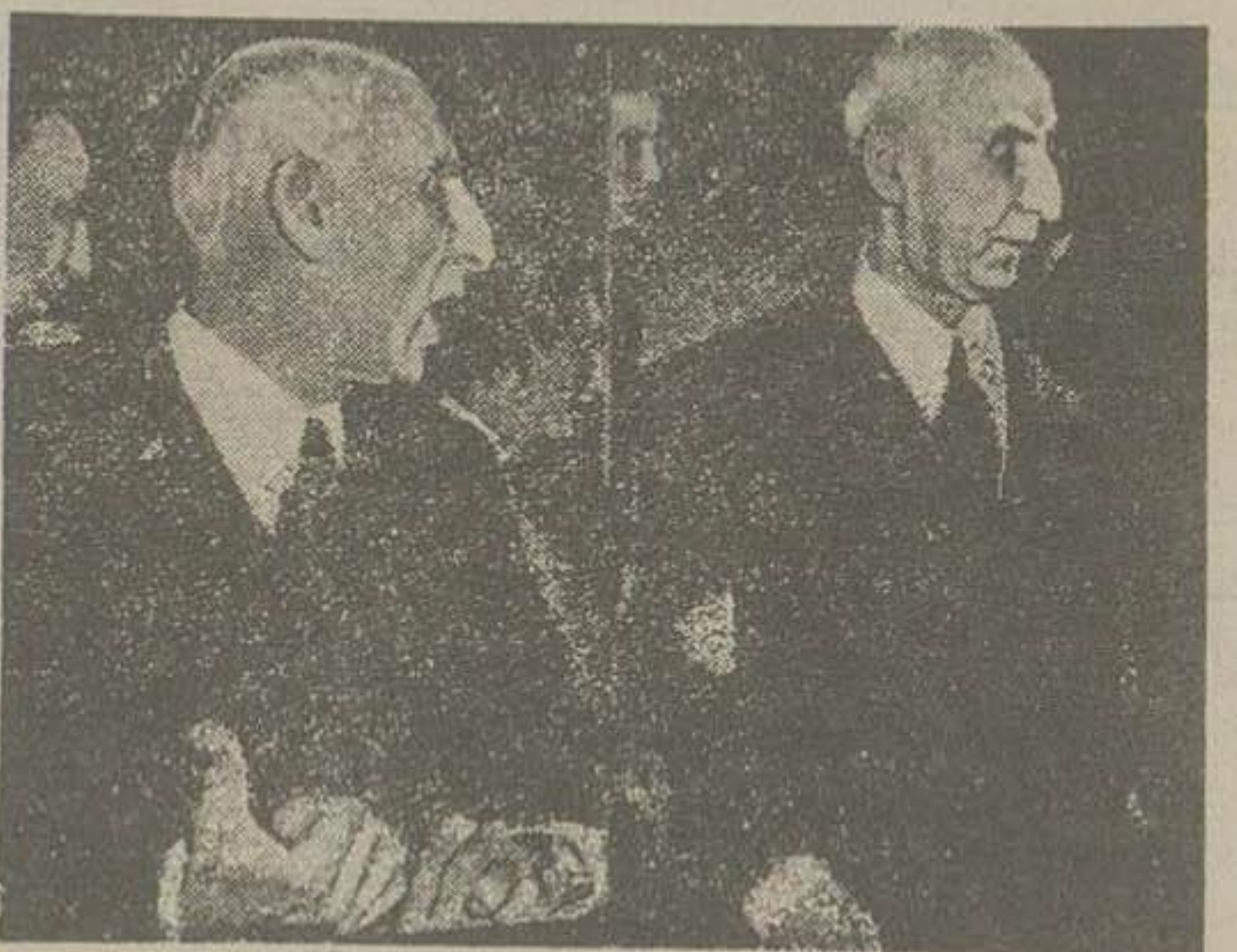
دو عکس از آقای دکتر مصدق در جلسات دادگاه لاهه

شما هم یادداشت کنید از موقیعه مدافعت ایران در دادگاه لاهه نزدیک بود بیابان برسند دکتر مصدق در هتل پالاس مراکش و کران جوابهایی بود که نمایندگان انگلستان قرار بود بدهند و بکلیه نمایندگان ایران میگفت که قسمت مهم کار شما در دادگاه نمایندگان انگلستان شروع میشود که نمایندگان انگلستان نطق های جوابیه خود را ایراد نمایند و با آنها توصیه میگرد که در دادگاه تمام هوش و حواس خود را بیاورند و با آنها نطق انتظار مشاهده کردند که نمایندگان انگلستان قبل از آنها آمده و مشغول فعالیت هستند. «سراریک بیگ» نماینده انگلستان بخصوص روی پیش بند نیشد اما اینطرف و آنطرف میرفت و حالت عصبی که داشت شدت پیدا کرده بود و شانه هایش بی اراده بالا و پایین میرفت وقتی نمایندگان ایران با تفاق رولن مشاور بقیه در صحنه چهارم