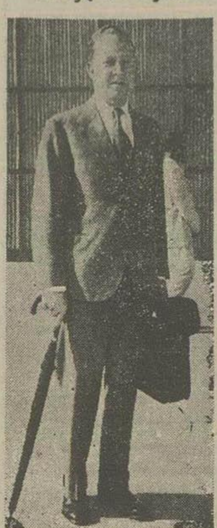
ميدلتن كلاراد سفارت انگلستان بامداد امروز با هواپيماي هلندي براي شركت در كنفرانس نمايندگان سياسي انگلستان در خاور ميانه و خاور دور به لندن رهسپار شد.