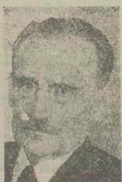
دکتر ویلهلم دریس

لايه - خبرگزاری فرانسه - دیروز، نخست وزیر هلند، دکتر «ویلهلم دریس» به هتل پالاس آمد و از آقای دکتر مصدق نخست وزیر ایران ملاقات نمود. این ملاقات جنبه تشریفاتی داشت و از طرف سفیر هلند دولت هلند با هیئت نمایندگی ایران خبری در این مورد پروژنامه نگاران و مضمین آژانسها داده نشد. این ملاقات بطور ناگهانی بعمل آمد و بهین جهت در محافل سیاسی لاهه و بین قضات تأثیر فوق العاده ای کرده است. موضوع فروش نفت ایران بشوروی آیا هیئتی از جانب شوروی بهر آن آمده و برای استخراج نفت استانهای شمالی و تاسیس دانشکده نفت در تبریز با دولت وارد مذاکره شده است؟ نیویورک - خبرنگار روزنامه «کریچن ساینز مونیتور» - چاپ امریکا از بروکسل با نیخت بلوک گزارش میدهد. طبق گزارش سرویس خبرگزاری «جبهه استقلال ملی بلووک» مذاکرات مربوط به بهره برداری دامنه دار از نفت شمال ایران از طرف شوروی در شرف انجام است.