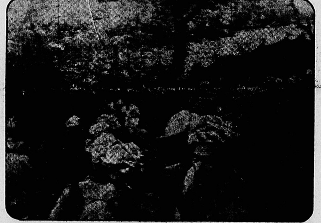
پیشترگان کرد عراقی و رزمندگان ایرانی در پایگاه چریکی خود در کردستان عراق لحظاتی قبل از حمله به پادگان مرگسور عراق

فرار شرکت های امپریالیستی از عراق یک جاسوس امریکانی در تهران اعدام شد