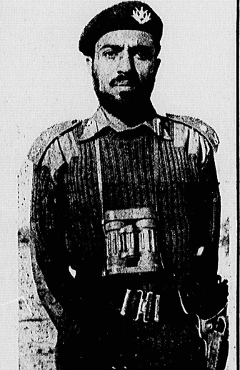
سلطان قابوس، پادشاه عمان، که تا اندامر شدن فاصله زیادی را باید طی کند!

آمریکا، فاصله دارد، آنها به سرعت میگردند به نحوی بر این مشکل مهم غلبه کنند و بدین لحاظ دولت آمریکا قصد دارد در یک کشور با چند کشور در منطقه خلیج فارس عملاً حضور نظامی داشته باشد، تا هم نیروهای ائتلافی منطقه روی این حضور حساب کنند و هم بتواند آنها را به تجاوز دست باز بگذارد. تاکنون توانسته است مراقات عمان را که در اصل پایگاه انگلیسی است، برای استفاده از پایگاه ها و تسهیلات نظامی آن کشور جلب کند. عمان از لحاظ جغرافیایی برای آمریکا ها بسیار مهم است، زیرا در مجاورت تنگه هرمز قرار دارد، تنگه ای که شاهراه دریایی برای عبور بخش بزرگی از نفت مصرفی جهان غرب خاصه ایالات متحده است. عمان که سلطان قابوس دارد و آن حکومت میکند، برای کمتر از یک میلیون تن جمعیت دارد و این یک مزیت دیگر برای آمریکا است که در آنجا مهارت کند.