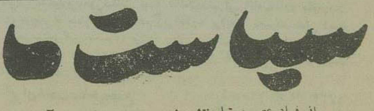
از فراد عصر مرتباً منتشر میشود ۸۱۲۵-آ

ARTUS شاهکار صنعت فلم خود نویس آلمان ۲۲۸۷ آ ۱۰-۲