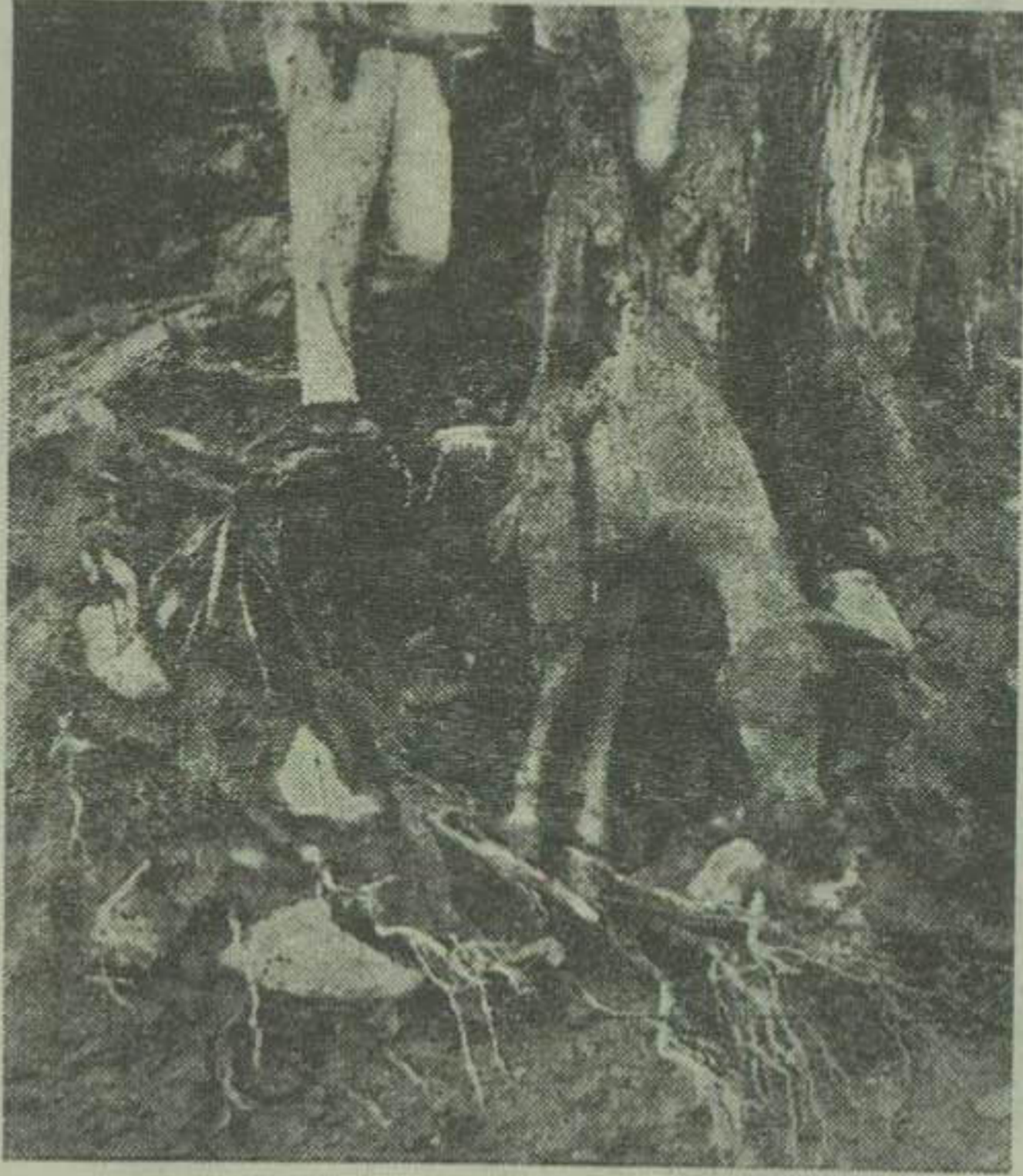
لاشه یک راس قاطر که بر اثر شدت جریان سیل امامزاده داود بدرخت چسبیده شده است.

زیراعده می از ژواروسا کتین امامزاده داود، فرحزاده، یونجه زار میروح شده اند و اکیب اعزای نملامشغول مداوی این مجروحین میباشد.