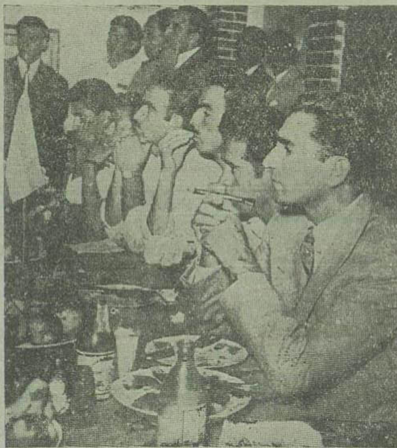
اعلیحضرت پس از اینکه با دانشجویان درس میزغنا ناهار صرف کردند عملیات تفریحی دانشجویان را مشاهده میفرمایند

اعلیحضرت همایونی در اردوی مبارک آباد فرمودند: یگروز زندگی با استقلال صد ها سال زندگی با تنگ و پرده گی توجیح دارد در میان باران شدید ذات ملوکانه از کلیه قسمتهای اردوی دانشجویان بازدید بعمل آوردند