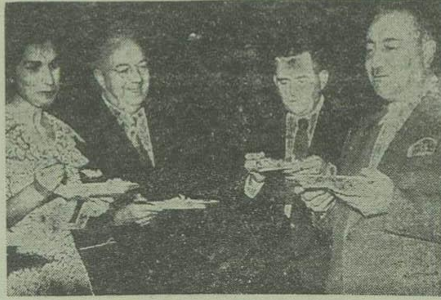
در ضیافت هتل در بند از راست بچپ آقایان احمد حسین عدل وزیر کشاورزی دکتر راسکلی و یکی از بانوان مشاهده میشوند

بناسبت عزیمت آقای دکتر راسکلی رئیس قسمت کشاورزی صندوق مشترک ایران و امریکای پربیش از طرف آقای احمد حسین عدل وزیر کشاورزی ضیافتی بشام در هتل در بند داده شد که در آن مجلس آقایان وزیران و مدیران کل و روسای ادارات و نگاهبای وزارت کشاورزی و آقایان و ادان یکی از مدیران صندوق مشترک ایران و امریکا و دو بانو رئیس اداره کبک های فنی امریکا در ایران و عده ای از متخصصین کشاورزی ایرانی و امریکائی و چند تن از مدیران جرایده حضور داشتند. پس از صرف شام آقای وزیر کشاورزی بیاناتی در پاره خدمات آقای دکتر راسکلی بامور کشاورزی ایران ایراد کرد و یک تخته قالیچه نفیس از طرف وزارت کشاورزی و یک قاب عکس زینا از طرف اداره کل زراعت و یک گلدان قره بر از گل از طرف اداره ترویج بوی اهداء گردید. سپس آقایان وارن و دو بانو در زمینه کشاورزی ایران صحبت کردند و بعد آقای دکتر راسکلی نیز شرحی در پاسخ آقای وزیر کشاورزی اظهار داشت و از هدایائی که بوی داده شده بود تشکر کرد. مجلس مهمانی که در ساعت هشت بعد از ظهر شروع شده بود مقادیر ساعت یازده خاتمه یافت.