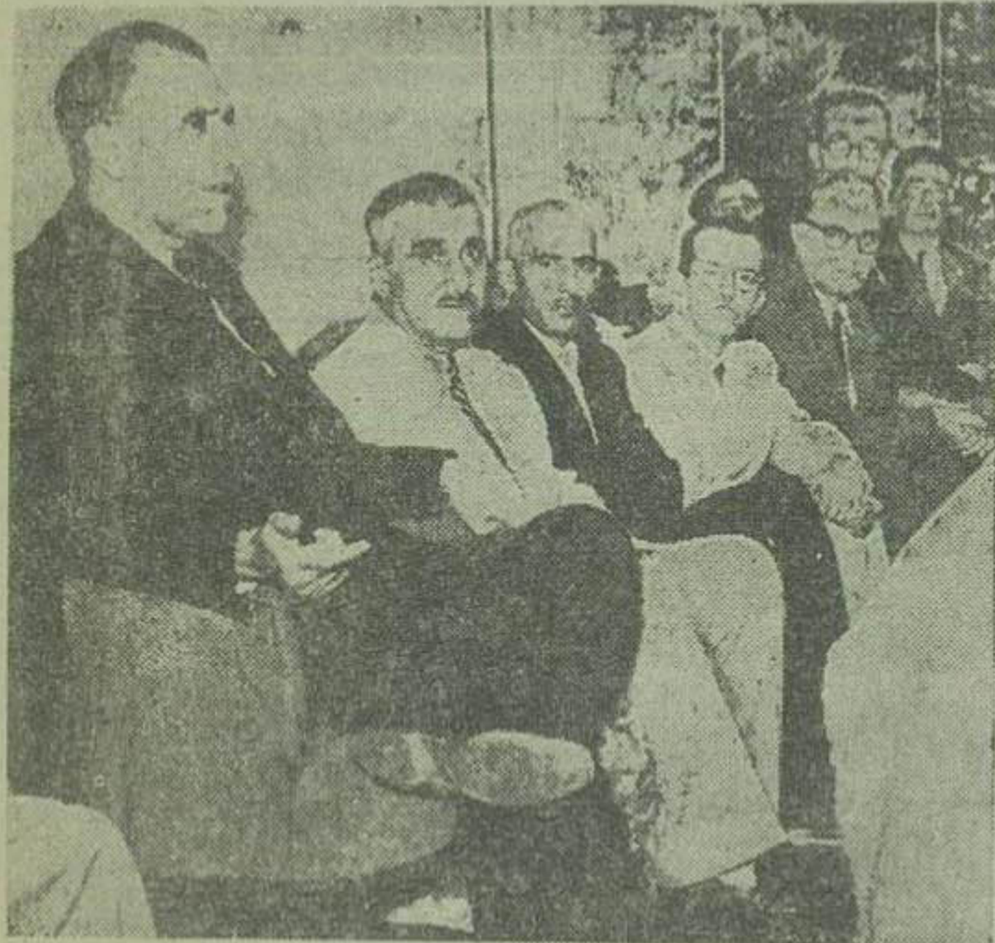
آقای نخست وزیر هنگام مذاکره با نمایندگان شورای خانه و برزن

اهم مشکلات در این مدت، مشکل نفت بود که در سالهای اخیر تمام وقت بقیه در صفحه چهارم