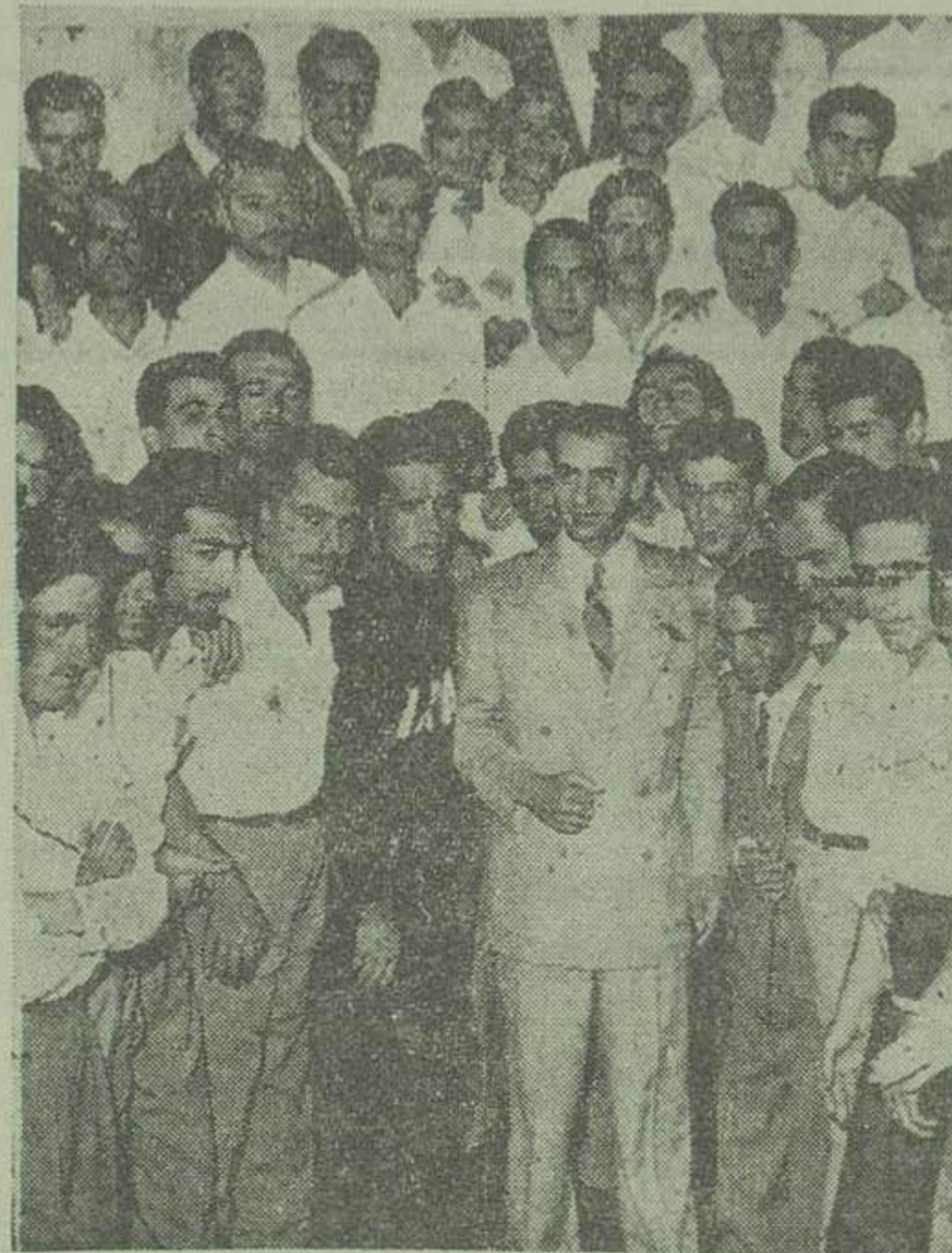
در عکس بالا شاهنشاه در میان جمعی از دانشجویانی که در اردوی آبی شرکت نموده اند دیده می شود

ها خیلی مرطوب و آلود بود آفتاب دیده نمیشد. ولی همه از کرمان عرق می ریختند فاصله بین پهلوی تا رشت بیش از سی و چند کیلومتر نیست ولی تا هالین مسافت کوتاه را طی کردیم سه مرتبه هوا بارانی شد در جاده ها آب راه افتاده بود و مرتبه آفتاب شد در راه بندر پهلوی تار شت سه یا چهار قطعه طاق نصرت زده بودند و در سراسر راه حتی