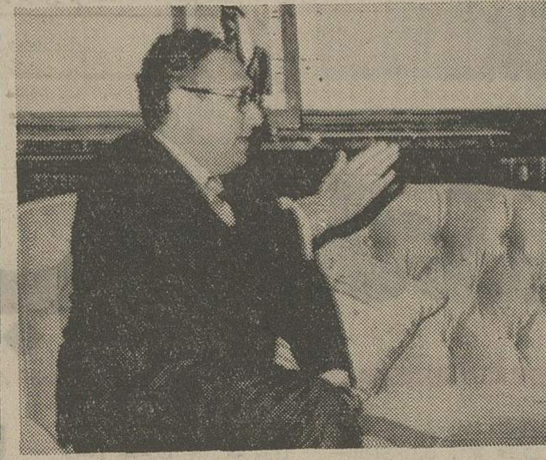
مذاکرات کی سینجر با ملک حسین پادشاه اردن بسبب آنکه مسئله فلسطین و تأسیس میهنی برای فلسطینی ها در آن مورد بحث قرار گرفت حائز اهمیت خاصی بود. عکس ملک حسین و کی سینجر را در جریان سفر وزیر خارجه آمریکا به عمان نشان میدهد.

است. اسرائیل متقاعد است که مرزهای جدیدی را در خاورمیانه تعیین کند. اسرائیل متعهد است مرزهای جدیدی را در خاورمیانه تعیین کند. اسرائیل متعهد است مرزهای جدیدی را در خاورمیانه تعیین کند.