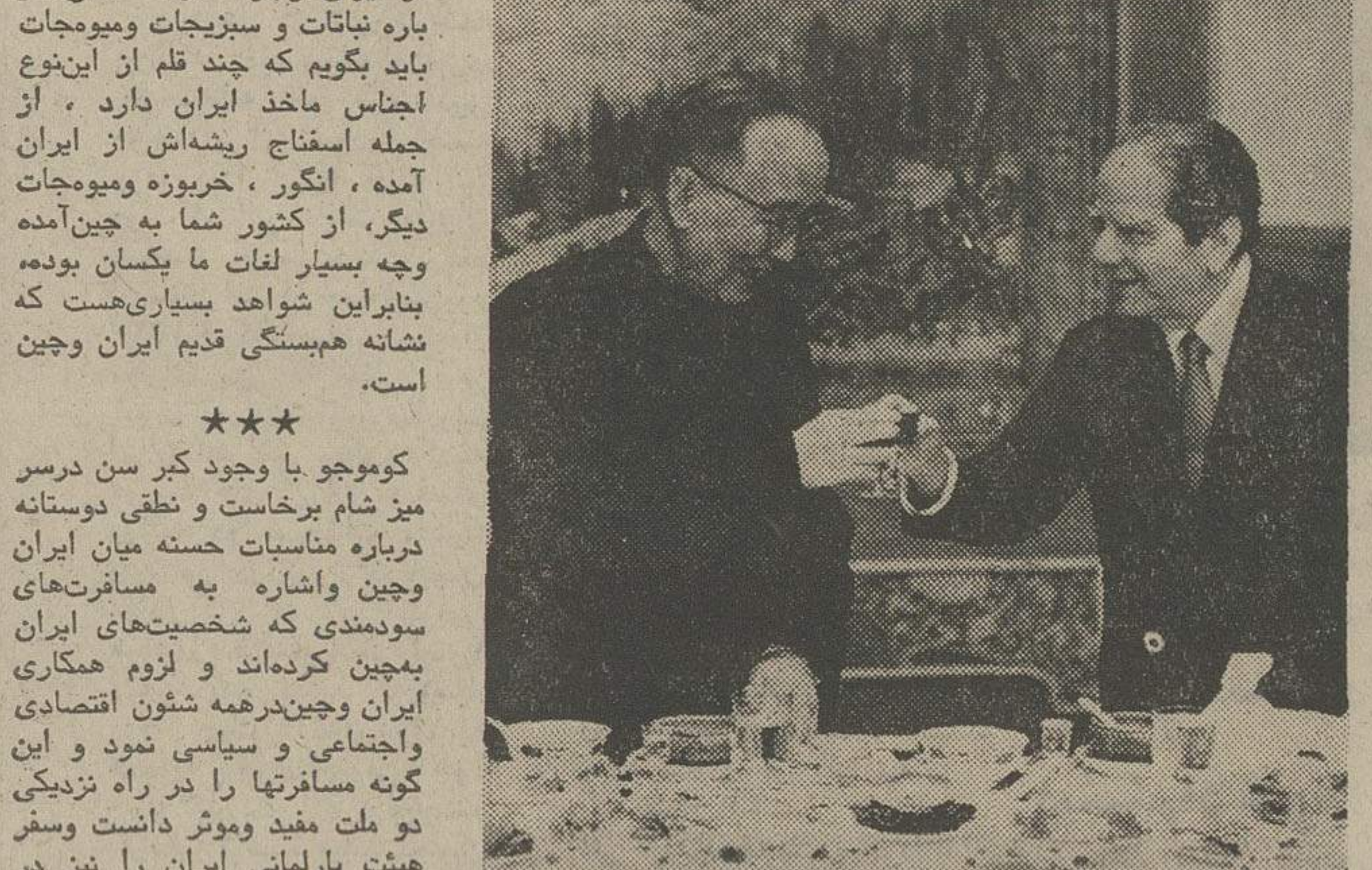
کومو جو بایران در پایان جنگ بین المللی سفر کرد. او در تهران با مقامات ایرانی دیدار کرد و در مورد همکاری های اقتصادی و فرهنگی گفتگو کرد.