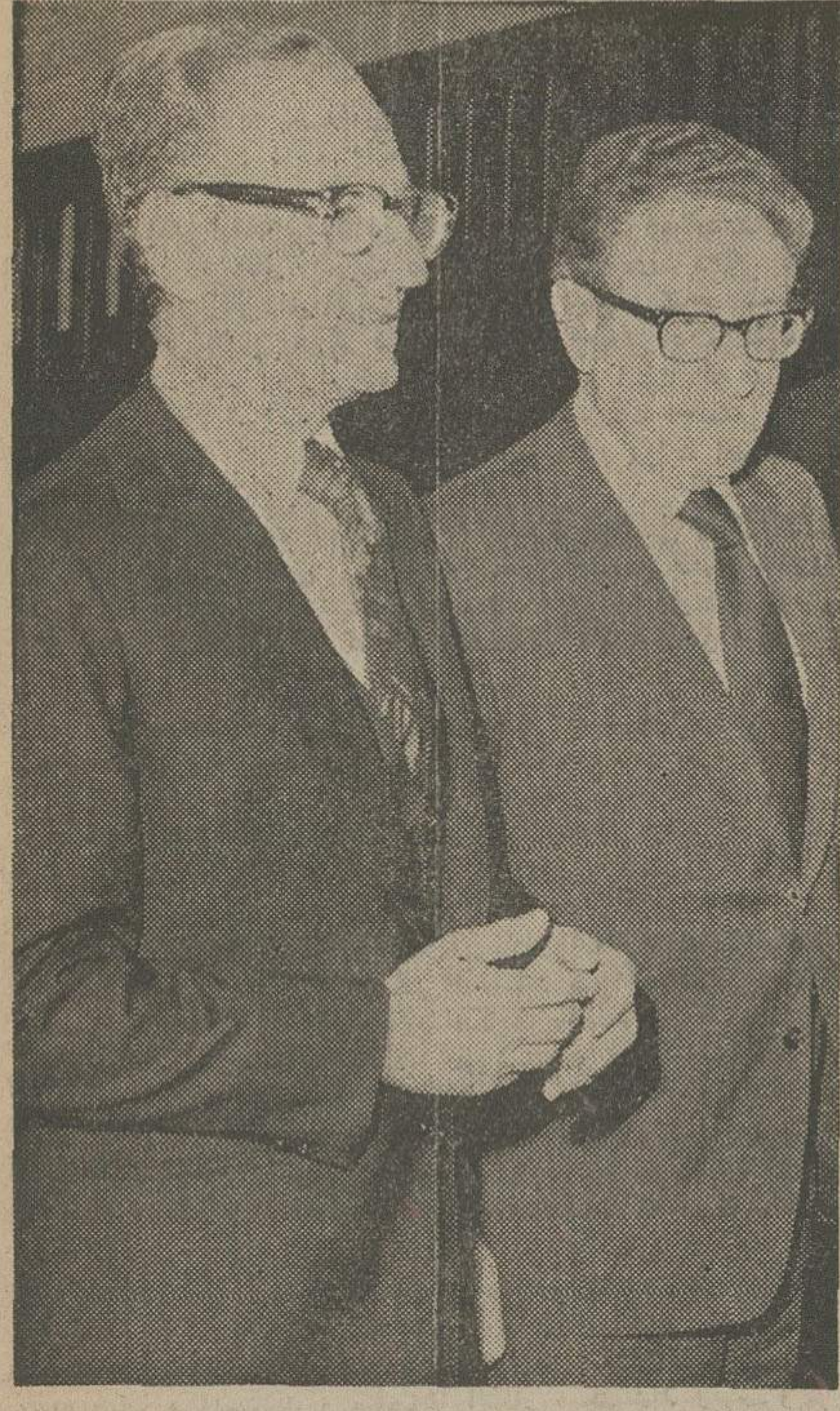
هنگام دیدار در پیشگاه ملوکانه شیراز

وزیر خارجه امریکا سه ساعت شرفیاب بود کی سینجر طرح صلح را باشاهنشاه در میان گذاشت