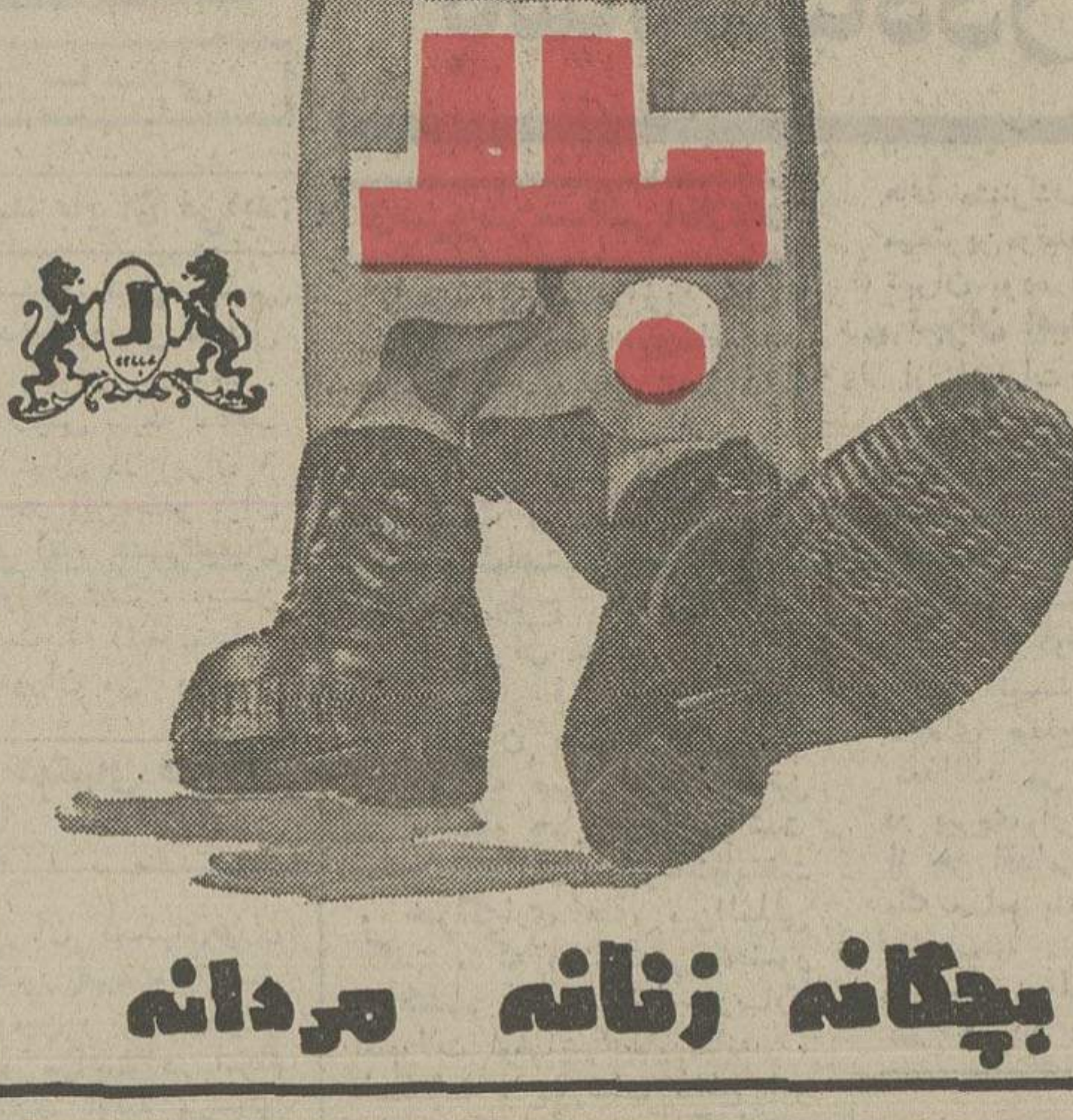
بچگانه زنانه مردانه