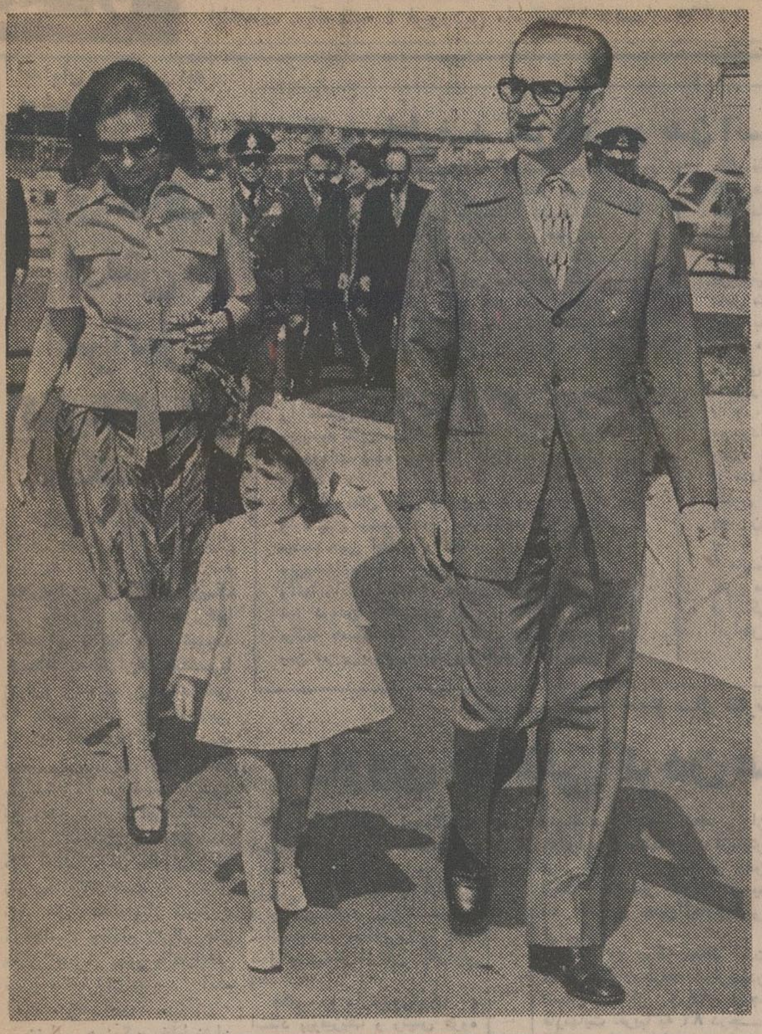
عزیمت شاهنشاه و شهبانوبه کیش

شاهنشاه در مراسم سلام نوروزی فرمودند: نظم اقتصادی و سیاسی جهان مورد ارزیابی مجدد قرار گرفت سفیر شوروی: ابتکار شاهنشاه توجهتوا اعضای هیئت سیاسی مقیم تهران را جلب کرده است. در صفحه ۴ (ستون سوم)