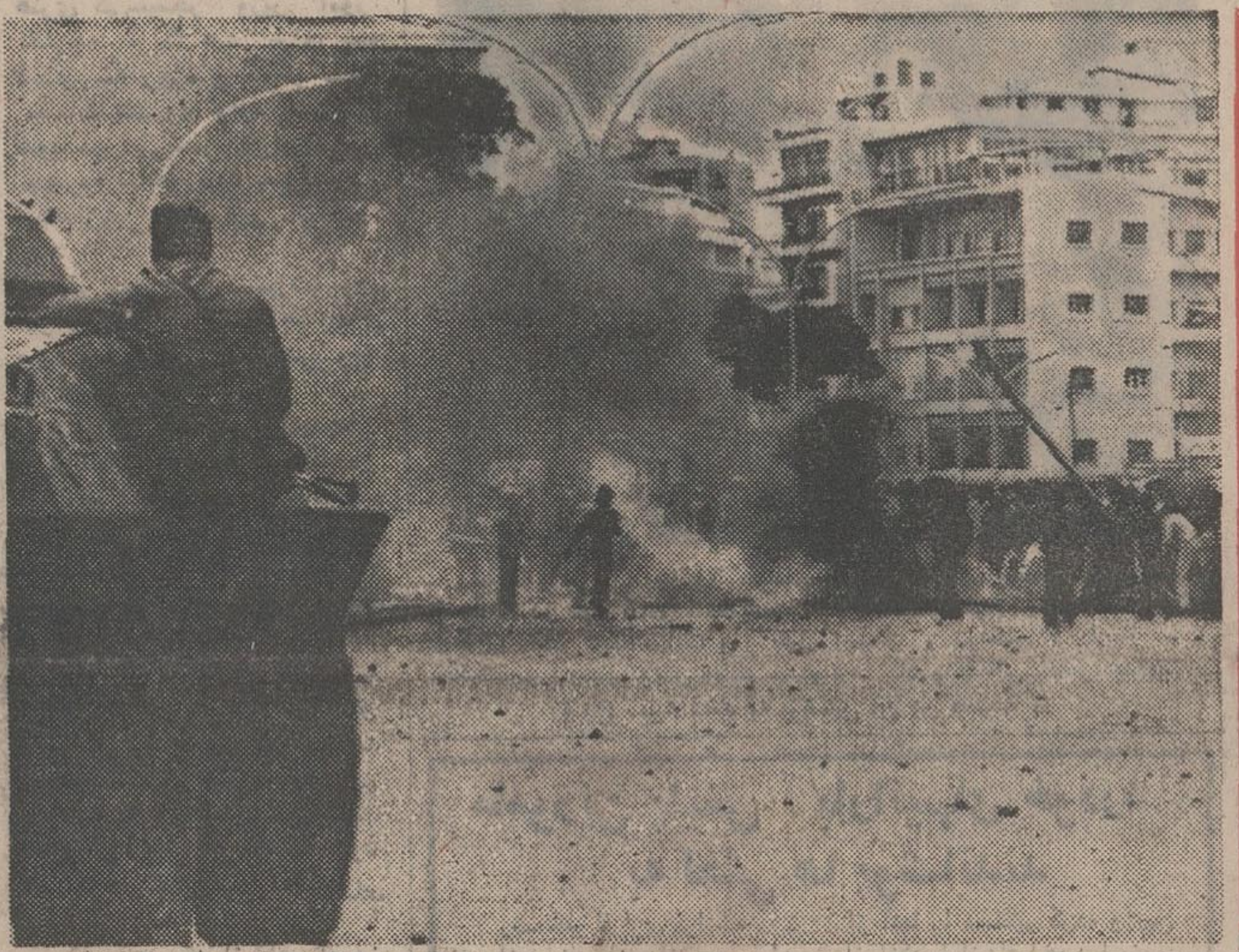
در تظاهرات شدیدی که از طرف دانشجویان لبنانی در بیروت برپا شد تظاهر کنندگان با افرادی که به زود خود برداشتند در عکس یک پلیس لبنانی دیده میشود که روی زهریوش خود نشسته و دانشجویان را که مشغول کشن تیرهای چراغ برق و آتش زدن درخت هاستند از آنها را میدانان ایجاد کنند، تماشا میکند. عکس رادیویی اطلاعات

دانشمندان به ژنگ خطر سرطان دست یافتند * داروی طول عمر درجه حرارت بدن را میکاهد و عمر را به ۲۰۰ سال افزایش میدهد. در صفحه ۲