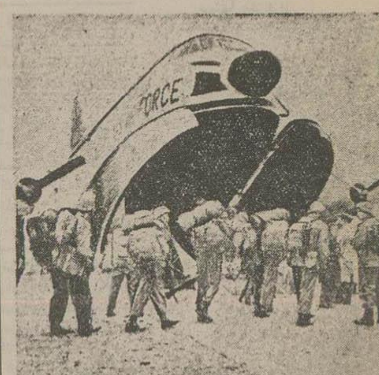
دیروز اولین دسته سر بازان پلیس صلح وارد مصر شدند. در اینجا یک دسته سر بازان نیروی پلیس صلح در دروز هنگام سوار شدن به هواپیمایی بیند

تیمر یادبود مقاومت قاهره - خبرگزاری فرانسه - دولت مصر تصمیم گرفت یک سری تمبر یادبود مقاومت قهرمانان برت سعید منتشر سازد. هارم شولد در قاهره ناپل - خبرگزاری فرانسه - هارم شولد در قاهره ناپل - خبرگزاری فرانسه - هارم شولد در قاهره ناپل - خبرگزاری فرانسه -