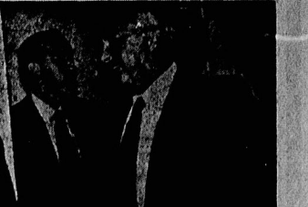
مکس رادویس اطلاعات

خبرگزاری فرانسه، کاسبار و اینبرگر وزیر دفاع آمریکا دیروز در بیانیه ای اعلام کرد که دولت آمریکا در تلاش است تا با کوبا همکاری کند تا در مبارزه با تروریسم و مبارزه با قاچاق مواد مخدر و مبارزه با قاچاق اسلحه همکاری کند.