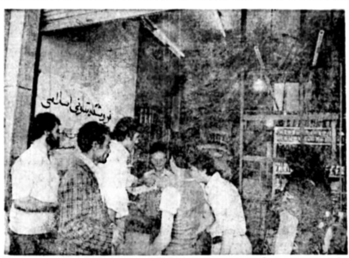
در حالی که فروشگاه‌های آزاد برخی آمریکاها یک کیلوگرم آرد کمتر می‌فروشند. اداره امور ارزاق بدینال اجرای طرح ضربتی مبارزه با گرانفروشی واحده جدیدی بنام اداره امور ارزاق از سوی کمیته امور صنایع امام

این فروشگاه‌ها کلیه کالاهای پرمصرف مردم از قبیل مرغ، تخم‌مرغ، حبوبات، مرغ و حتی گوشت گوسفند هم فروخته می‌شد. حتی در بعضی از میدان‌ها و خیابانهای تهران کامیون‌ها و وانت‌های پر از مرغ و تخم‌مرغ قرار داده شد و مرغ و تخم‌مرغ را با قیمت مناسب در اختیار مردم گذاشتند. در شرایطی که دولت فاسد گذشته سعی داشت با ایجاد گرانی مصنوعی و ضربت زدن بر بیکر اقتصاد سلامت زندگی مردم را فلج کند و آنها را وادار به تسلیم نماید، ایجاد این فروشگاه‌های تعاونی یک حرکت صدرصد انقلابی بود که به همت جوانان مبارز در مرحله وجود آمد. این واحدهای تعاونی نیز که از سوی کمیته امور صنایع امام تشکیل شده‌اند همان فروشگاه‌های تعاونی اسلامی هستند که در زمان انقلاب رخ زده بودند. انبارهای چهارمکانه در تهران