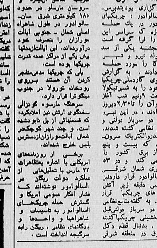
یک کمبارز فیکار کوله ... بر نامه تبلیغاتی وزارت خارجه آمریکا ... ۱۰۰ میلیون ... ۶۰۰ ...