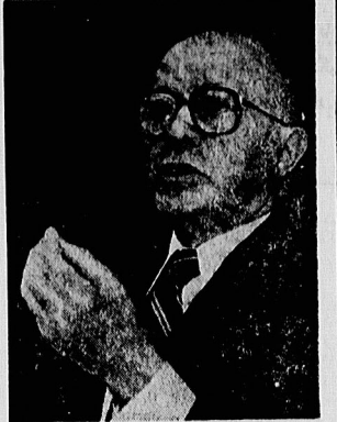
یحیی م. خواهد هراز مرخص نواریه عزم و خرابه غریب رود اردن رابه قلمرو تحت اشغال خود ملحق کند

فیوروت بریتانیا فراز داشته است. این توافق بین حاصل شده است که در قاره بیانی در مورد دیگر مناطق اشغالی در خارج فلسطین، نظیر سینا و جولان، با گفتگوهای صلح آید (۱). بین امرب اسرائیل تعیین شود. تا آنجا که این تصمیم باوضع شبهه‌نهاییه سینا مربوط نگردد، این نظر به احترام این کشور است (۲). اما این موضوع در مورد جولان صاف نمی‌گردد، جایی که سابقه نداشته است زمانی تابع حوزه اراضی قاره‌ای فلسطین بود باشد. این مسئله حتی به ذهن کشیده است که در آنگونه که مناقشه‌کننده ریس آن بود بوسر برسد. بکن ادعا کرده است که ارتفاعات جولان برای دفاع از سوسی و روسا های شمال این کشور (فلسطین) اشغال شده) دارای اهمیت زیادی است. آمپیتکایس‌کودر آجا حدود سی آبادی اسرائیلی بنشین جدید قرار دارد. همچنین رژیم اسرائیل در نظر دارد در آینده نزدیک هفت آبادی دیگر تاسیس نماید، منطقه به این رژیم حکم می‌کند که مرزهایش را کمی بیشتر به جلو ببرد و فیتواند از این آبادیها حراست کند.