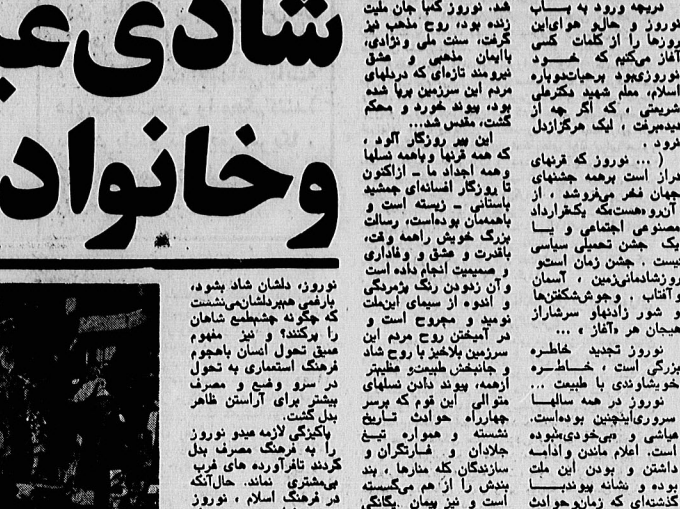
شادی عید را با رزمندگان ... خانوادهدشده تقسیم کنید ... ۱۰۰ میلیون ... ۶۰۰ ...