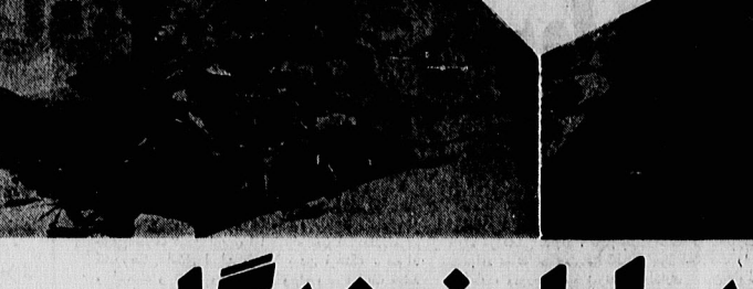
مهری اوشکایا ... مردم مسکن کهنه‌بناها گند و بار زشتان میوه‌ها را خوار می‌کند ... ۱۰۰ میلیون ... ۶۰۰ ...