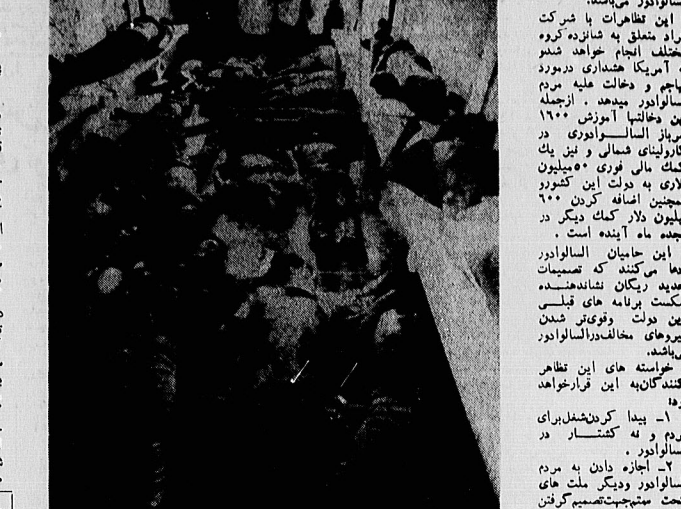
در دادگاه ... افکار عمومی ... ۱۰۰ میلیون ... ۶۰۰ ...