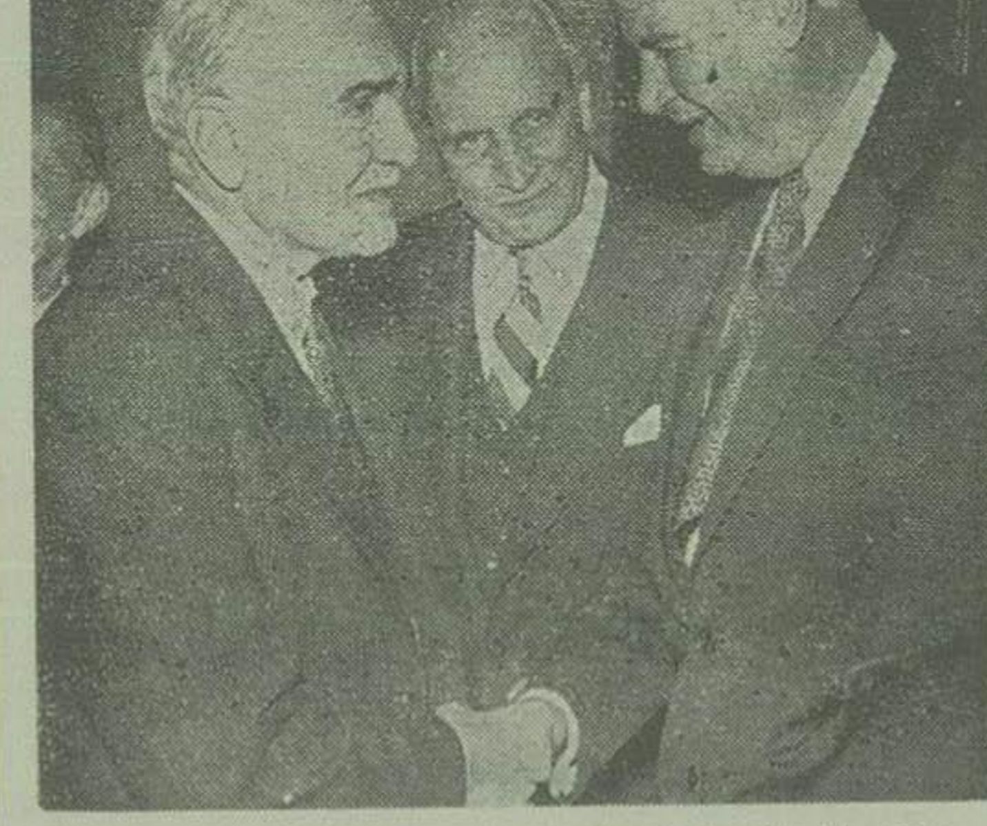
در عکس بالا سناتور ایریگر عضو حزب جمهوریخواه امریکا در جلسه ضیافت دیشب منزل آقای هندرسن سفیر کبیر امریکا هنگام که آقای تقی زاده ستانوردیده میشود

دیشب در منزل سفیر کبیر امریکه با ضیافتی پر باشده بود