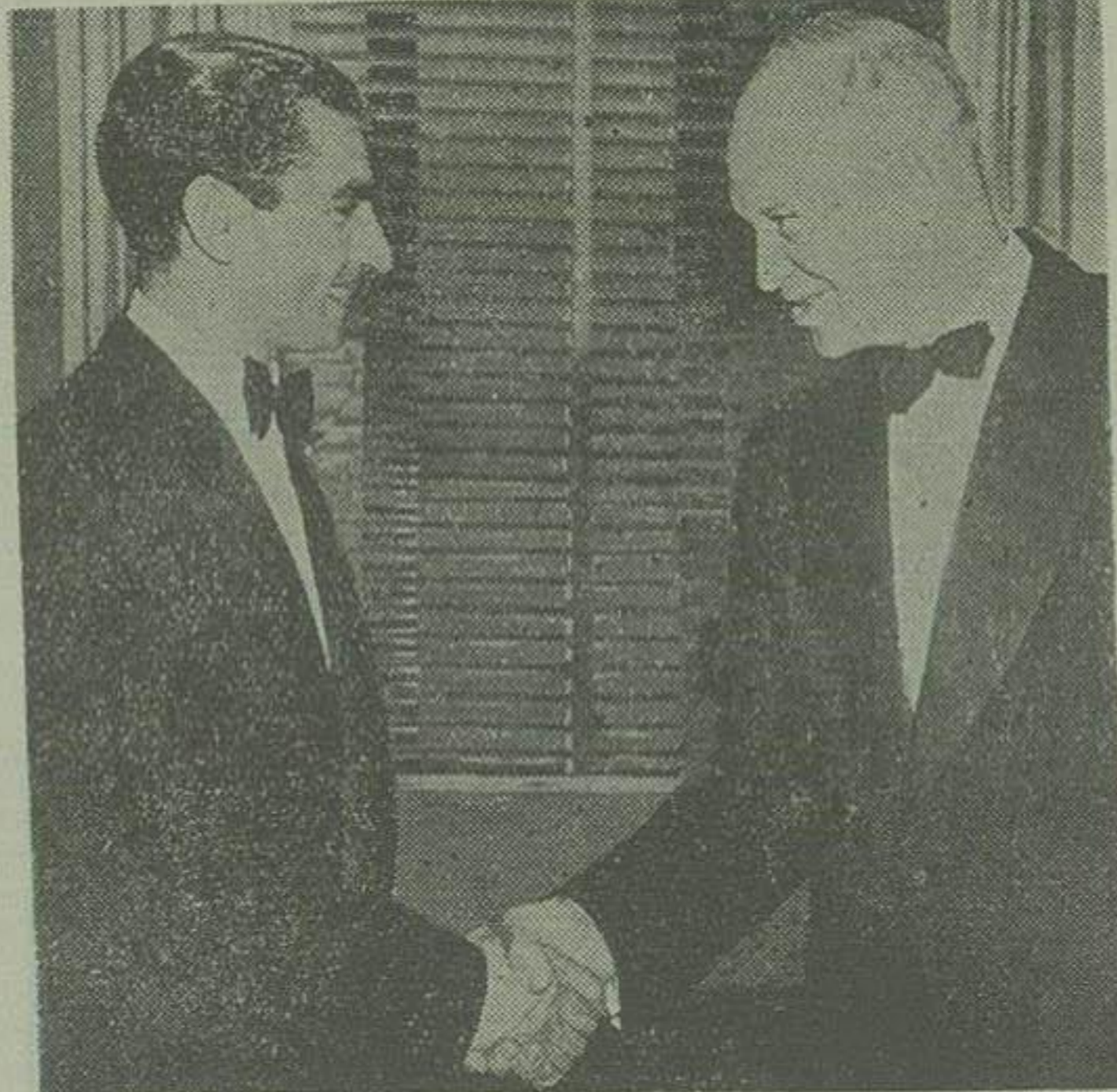
اعلیحضرت همایونی امروز در کاخ سفید واشنگتن با پرزیدنت آیزنهاور رئیس جمهوری امریکا ملاقات فرمودند این دومین دیداری است که شاهنشاه ایران و آیزنهاور بعمل آورند اولین ملاقات در سال ۱۳۲۸ بود که در آن موقع ستر ایزنهاور عهده دار مقام ریاست دانشگاه کلمبیا بوده و هنگام بازدید دانشگاه بود اعلیحضرت همایونی معظم لرا در باشگاه دانشگاه ملاقات کردند. در عکس بالا اعلیحضرت همایونی و پرزیدنت آیزنهاور

ملاقات شاهنشاه با لای دولت امریکا در تحکیم روابط دوستانه تأثیر زیاد خواهد داشت