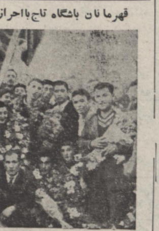
در کاروانسرا سنگی آقهدر دست گل و حلقه گل بگردن قهرمانان انداخته شده که دیگر روی و زرشکاران دیده نمیشد. جریان آنرا در صفحه پنجم ملاحظه فرمائید.

مهناخانه تاج محل از بناهای زیبای بیشی است که شمت و هشت سال پیش ساخته شده و امروز هم در رفیف بهترین مهناهای هند محسوب میگردد. این شماره در ۱۰ صفحه انتشار یافت