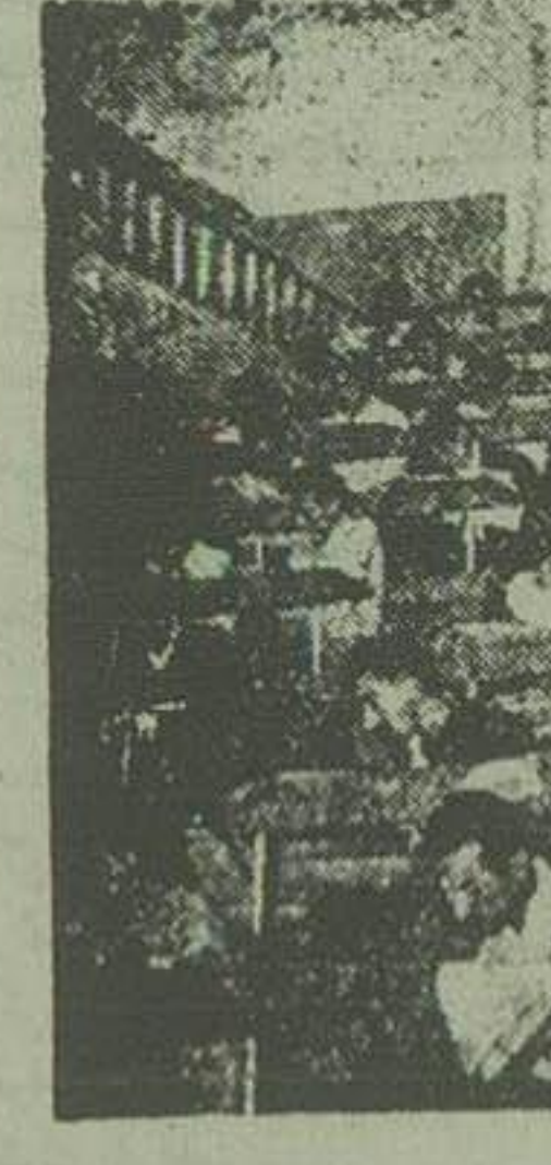
برای دیگر سبقت میگیرند

ولی آیا کسی فکر این «راهه مجبور میشود در یکی از دبیرستانهای شده باهت؟