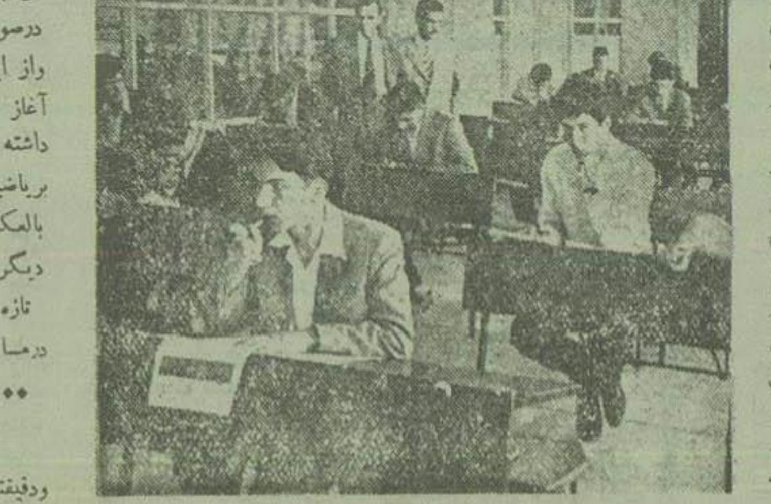
در اندیشه ورود به دانشکده

کلاس هفتصدی شرکت نفت ۷۵ نفر دانشجو هینخواست ولی ۲۸۰۰ نفر در مسابقه ورودی آن شرکت کردند