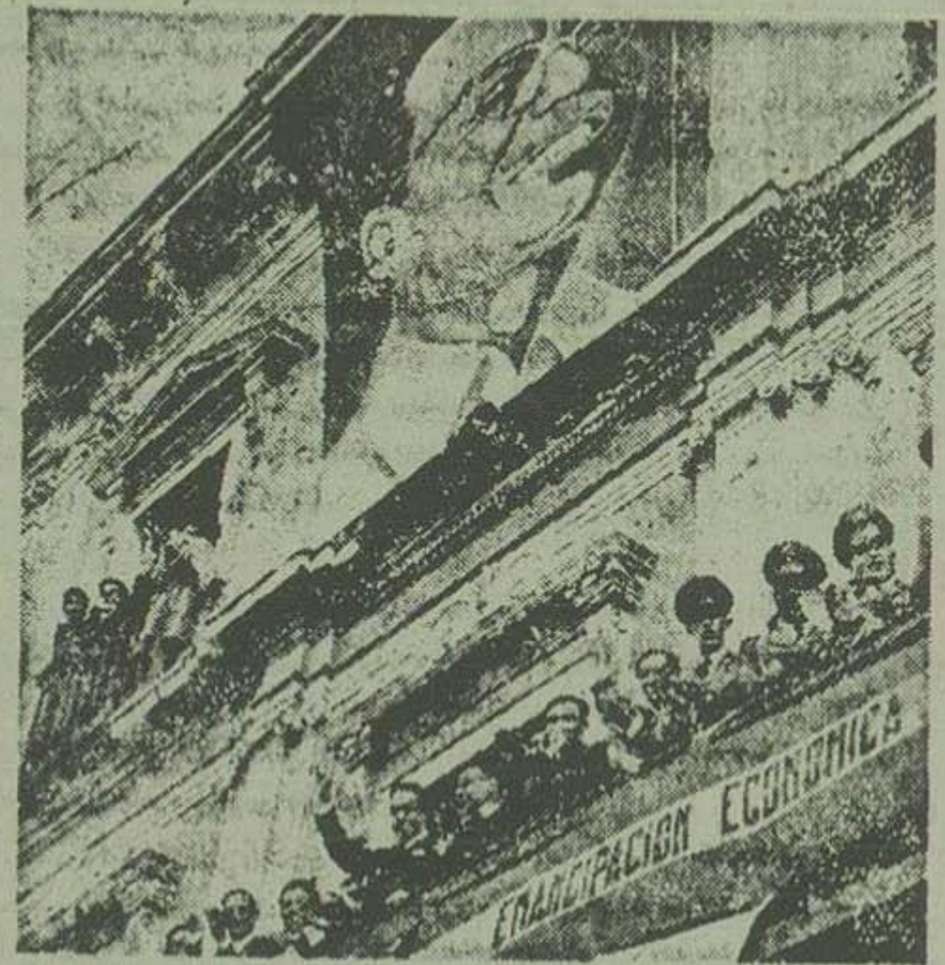
روز ۲۹ آوریل گذشته حکومت بولیوی چهارمین سال کودتای خود را جشن گرفت. در روزی با یک تون ریس جمهور وعده ای از سران دولت بولیوی دیده میشود. عکس بزرگ بالای با تون از رئیس جمهور بولیوی است.