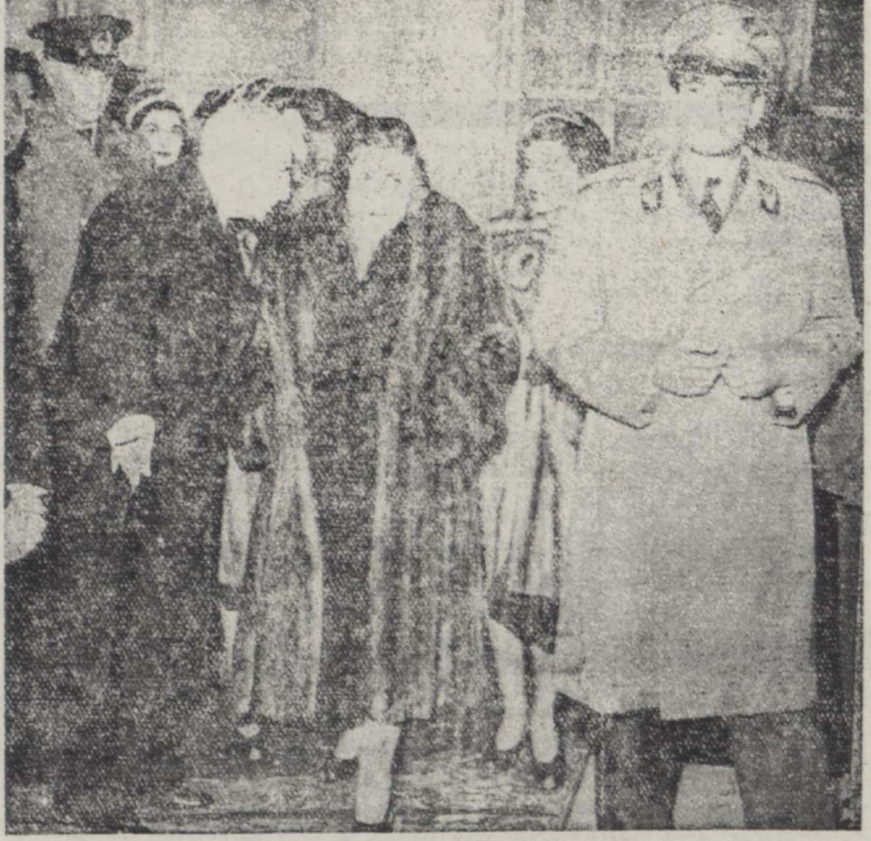
الیاحضرت همایونی با اتفاق علیاحضرت ملکه بتلار ایستگاه قدم می گذارند و الاحضرت شمس پهلوی و تیسار سبب زاهدی نخست‌وزیر و آقای والا بنیر در عکس بالادیده می‌شوند

الیاحضرت همایونی از دنیا حضرت در ایستگاه راه آهن استقبال فرمود