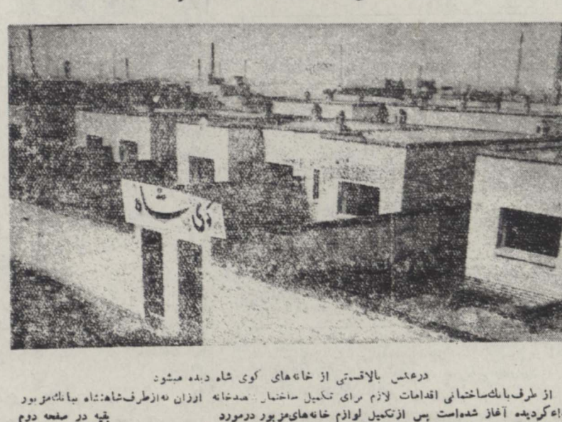
در عکس بالا قسمتی از خانه‌های کوی شاه دیده میشود از طرف بانک ساختمانی اقدامات لازم برای تکمیل ساختن صدخانه ارزان در اطرف شاه‌شاه میانکامیون اهداء گردیده آغاز شده است پس از تکمیل لوازم خانه‌های مزبور درمورد بقیه در صغه دوم