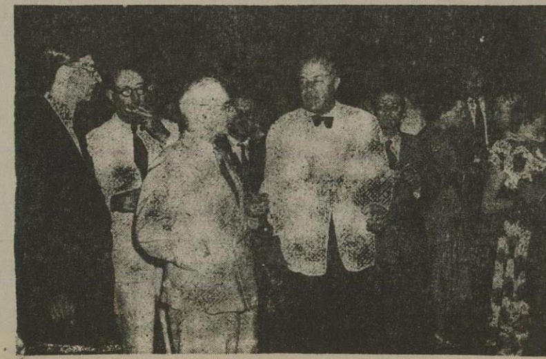
دیشب از طرف سفارت انگلیس دعوتی از افسرهای مقیم تهران و بانوانشان برای ملاقات آقای استوگس بعمل آمده بود عکس بالا مستر استوگس و سران انگلیسی فرید و ادیبان مقیم تهران نشان میدهد

بلاخره کنفرانس سانفرانسیسکو تشکیل شد و در مشور این کنفرانس آزادی ملل را محترم شمرده و تاملتها در محیط آزاد بتوانند زندگی کنند.