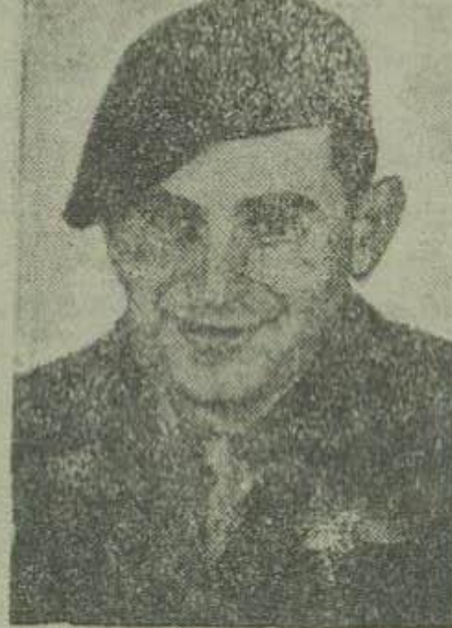
سروان و ستر لینگ عامل اصلی شورش اندونزی

دیشب سروان عزیز طی نطقی اظهار داشت که ما تا آخرین نفس از رسیدن مهابت و خونبار با ارتش دولت ممانعت خواهیم کرد