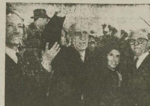
آقای دکتر مصدق هینکه از پلکان هواپیمایش را در فرودگاه نیویورک زمین گذاشت آقای نظام رئیس مجمع عمومی سازمان ملل بوی غیر مدم گفت...