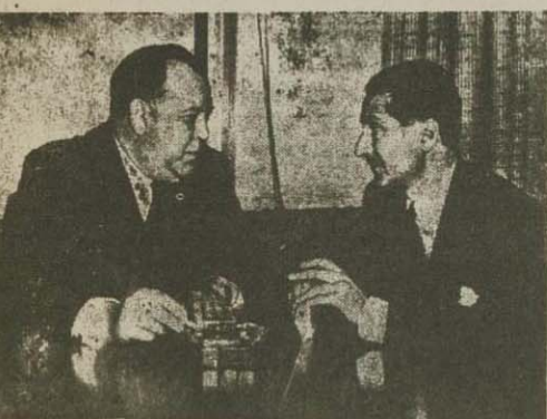
انتظار رئیس مجمع عمومی و تریگولی در باره مذاکره با یکدیگر مشاوره کردند.

دولت انگلیس لزوم اتمام کرد که زمینه ملاکرات ایران و انگلیس را فراهم سازد و ضمنا دولت ایران بعنوان نقض رای دادگاه لاهه مقصر شناخته شود با آنکه معاون وزارت خارجه و نمایندگان دولت امریکایی کرده اند نمایندگان ایران با قطعنامه جدید دولت انگلیس موافقت نمایند مع الوصف دکتر مصدق بهیچوجه زیر بار دخالت شورای امنیت نرفته امروز تریگولی و نظام بطور خصوصی مدنی با دکتر مصدق ملاقات و مذاکره کردند. نقل این در باره حل مسئله نفت ایران و مندرجات پاره ای از مطبوعات انگلیسی.