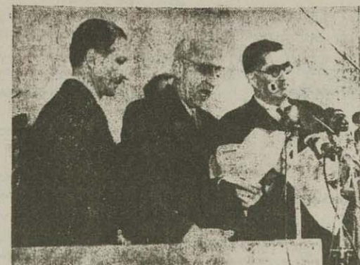
آقای دکتر مصدق نخست وزیر ایران پس از ورود به فرودگاه نیویورک در برابر سربازان فرانسوی بیای پلتهای یکفرماند...