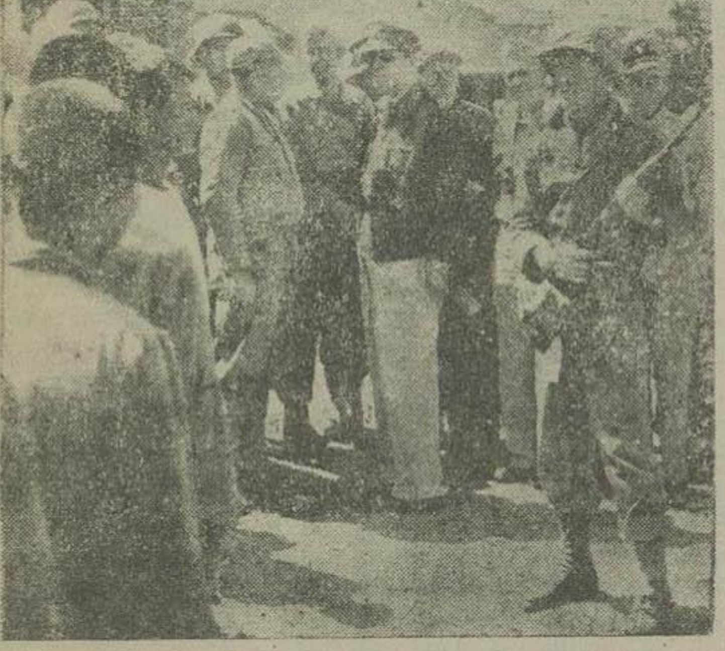
ژنرال ماک ارتور چند دقیقه قبل از آنکه شهر سول را بقصد توکیو ترک گوید، ژنرالان کره شمالی را باز دید نمود

واشنگتن - هتزی والاس رهبر سابق حزب مرفقی امریکا نامه ای به مائرتسه تونک نخست وزیر حکومت کمونیست چین فرستاده و وی را تشویق نموده است که از اطاعت کور کورانه مسک خودداری نماید