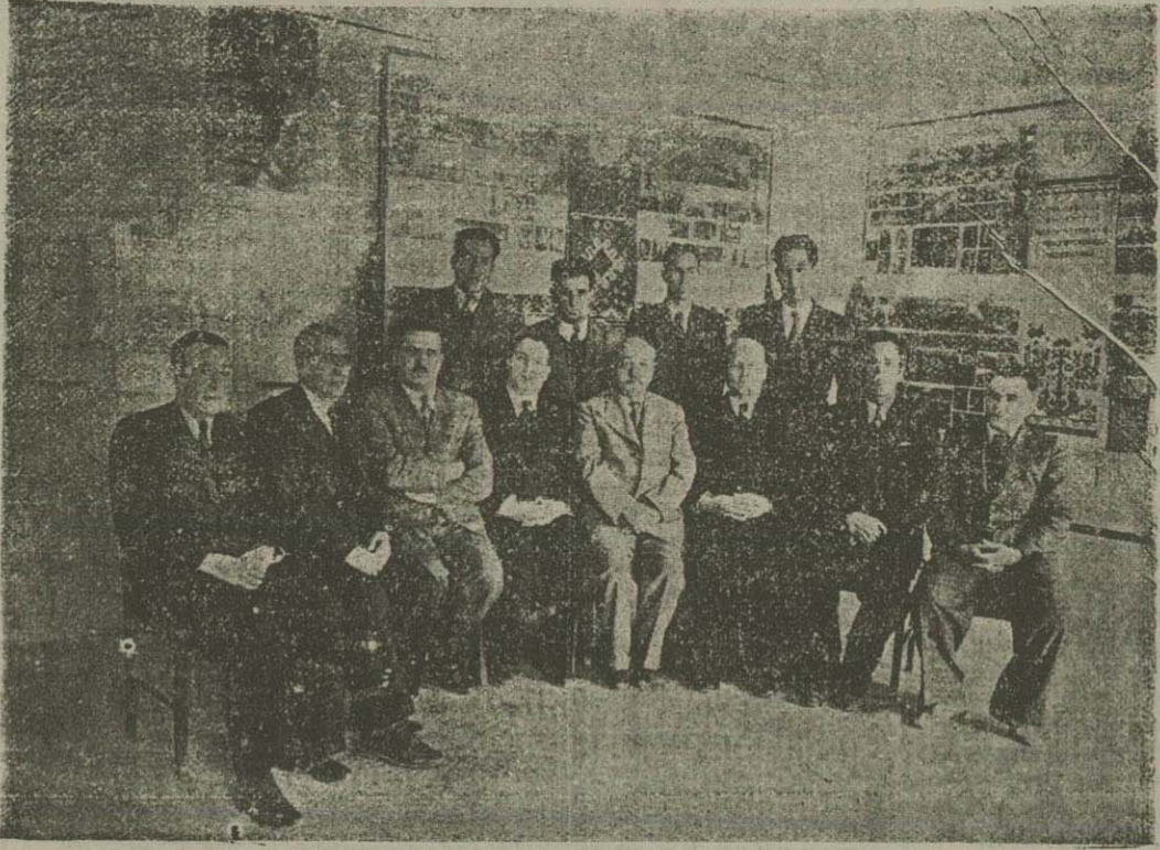
اعضای انجمن روابط فرهنگی آذربایجان ایران و شوروی

مامورین فرقه متجاسس دمکرات نیز مسائل مختلف از وجود بازرگانان و توانگران استفاده نمیشود . هر کسی از دادن بول ، داوا می زن ، دستر و آنچه مورد تمایل داد گستران و مامورین اداره سیاسی فرقه بود خودداری می کرد ، چنان «خلق دشمنی» امواتی مصادوم شودش زندانی میشد . باین ترتیبی بینم که از مکناسی و آزادی نوع دوم که قصدش رفاه حال صوبی و برقراری مساوات مادی و ازین برهن نفوذ سرمایه در امر اجتماعی است ، برای آذربایجان بظهور رسیده . درویکه نیرو های نظامی وارد تبریز شدند ، معده ای از بازرگانان هنگام استقبال شیدی میوه و برای سر بلان آورده .