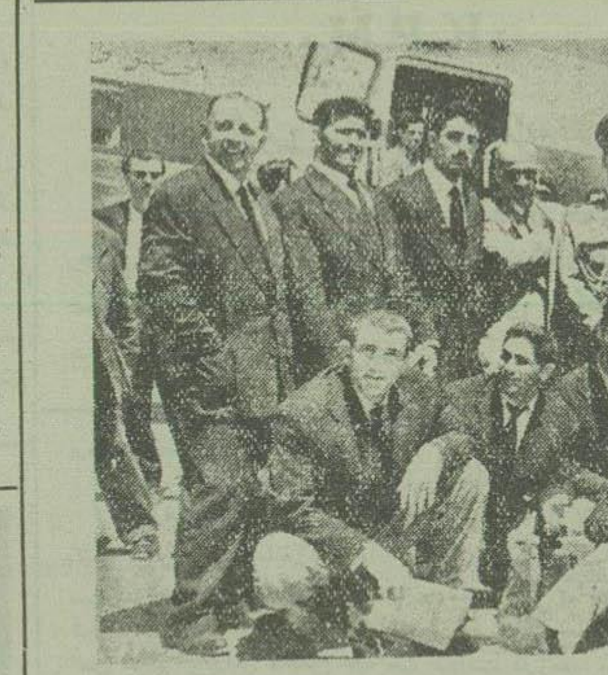
بهرمان تیم ملی کشتی ایران و مربیان و اولیای سازمان تربیت بدنی در فرودگاه مهرآباد دیده میشوند