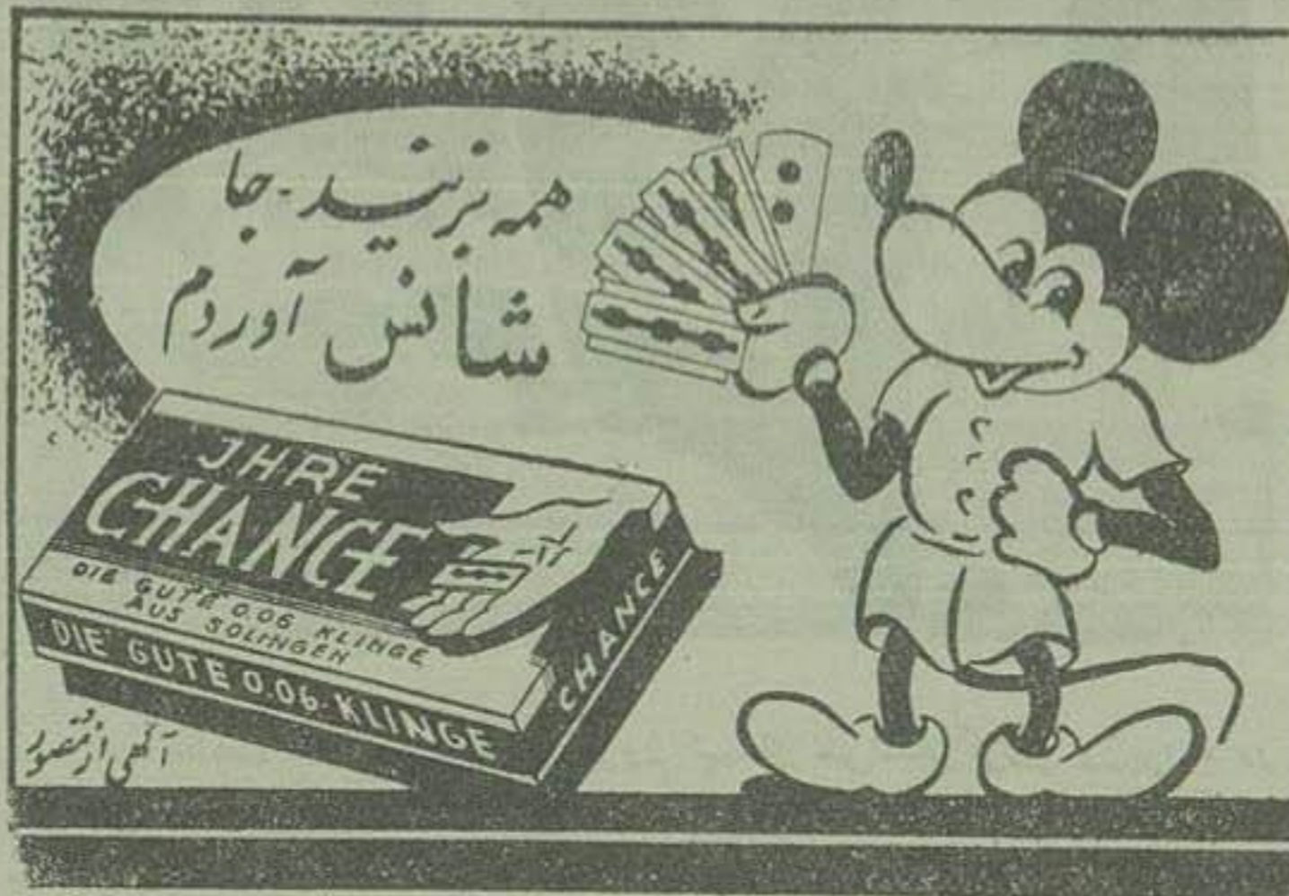
شیخ خود تراش شانس از بهترین فلزهای جهان ساخته شده است