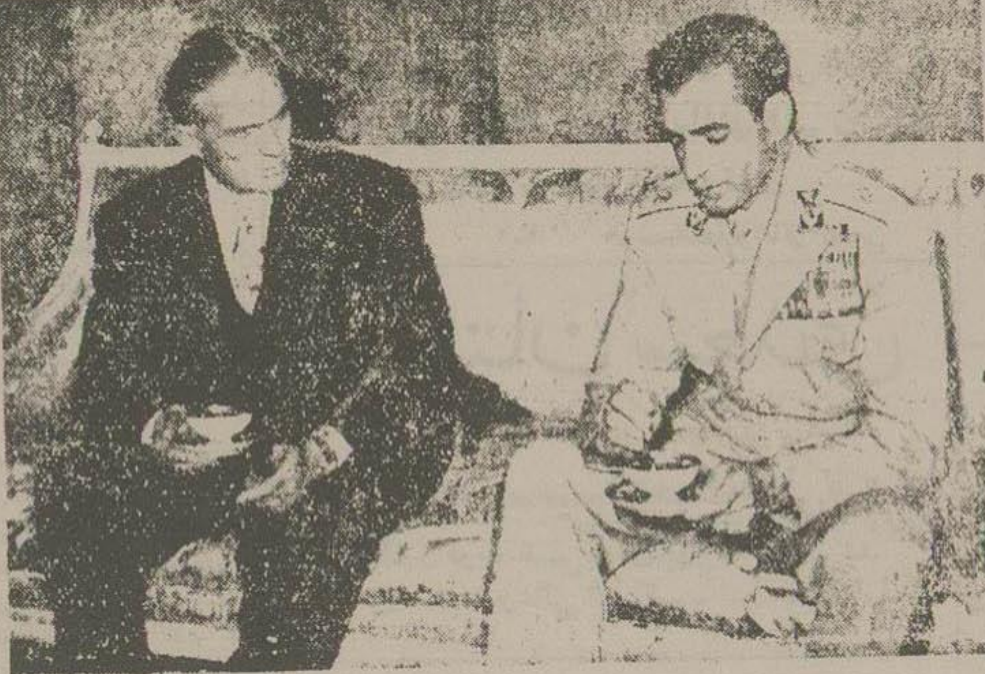
شاهنشاه و حضرت رئیس جمهوری لبنان در ملاقات عصر دیروز

مذاکرات زمامداران دو کشور پیش از یک ساعت طول انجامید و طی آن از مسائل سیاسی جهان و روابط دو کشور صحبت شد. حضرت رئیس جمهوری شاه را بطور آزاد در کاخ محل اقامت صرف کردند. اهداء تاج گل ساعت نه صبح امروز حضرت رئیس جمهوری لبنان آرامگاه شاهنشاه تقدیم رفته و تاج گل زیبایی نثار آرامگاه کردند. در این مراسم که همراهان حضرت رئیس جمهوری و هیئت معاونان و روسای وزارت دربار رئیس تشریفات وزارت امور خارجه حضور داشتند. در طرف خط سیرانومبیل حامل رئیس جمهوری و محوطه آرامگاه مأمورین نظامی کمربند شده بودند و هنگام ورود معطرله سطل آرامنگاه احترامات نظامی عمل آمد سپس بقید در صفحه بیستم