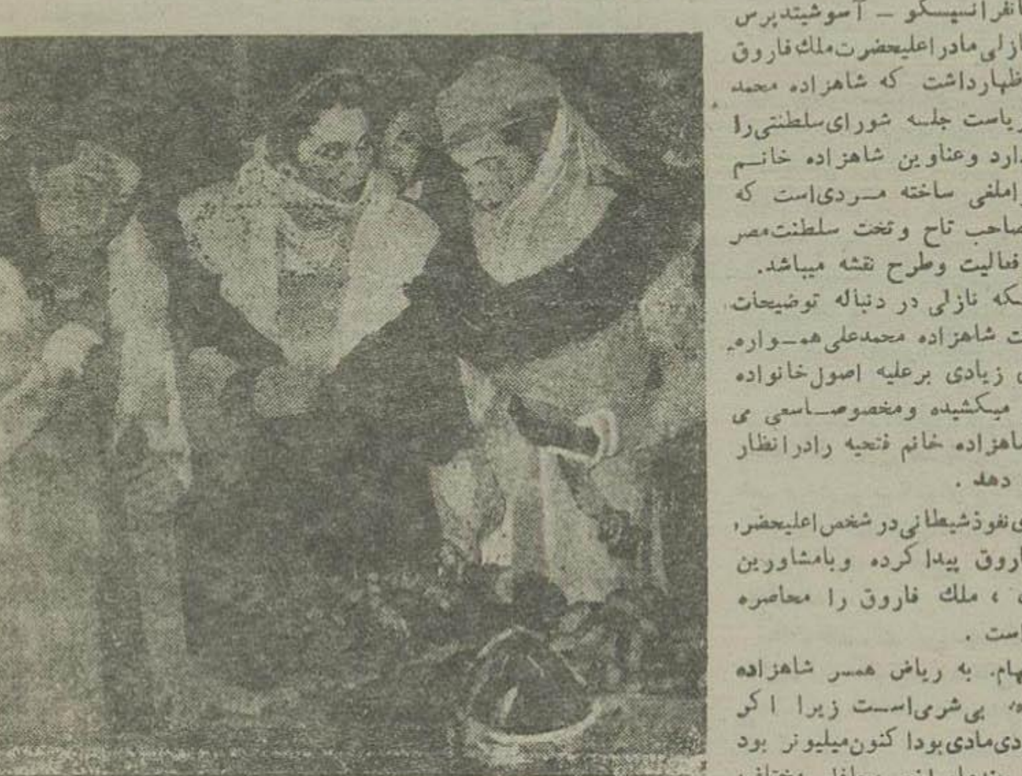
ملکه نازلی در آمریکا میان دو دختر خود شاهزاده خانم فتحیه (راست) و شاهزاده خانم فتحیه که هر دو در آنجا شوهر کرده اند مشاهده می شود.

وسعی میکنند که یکایک افراد خانواده سلطنتی را بدنام کنند ملکه نازلی میگوید کدام فرزندی با مادرش چنین معامله ای می کند ریاض غالی و شاهزاده خانم فتحیه تصمیم خود را موقوف به نظر ملکه نازلی کرده اند - ملکه نازلی میگوید طبق تجویز پزشکان مدت دوسال باید در آمریکا اقامت نماید - ملکه نازلی سمت گمان نمی کنم که دولت آمریکا مرا بخاطر عشق و ازدواج دخترهایم از کشور خود اخراج کند