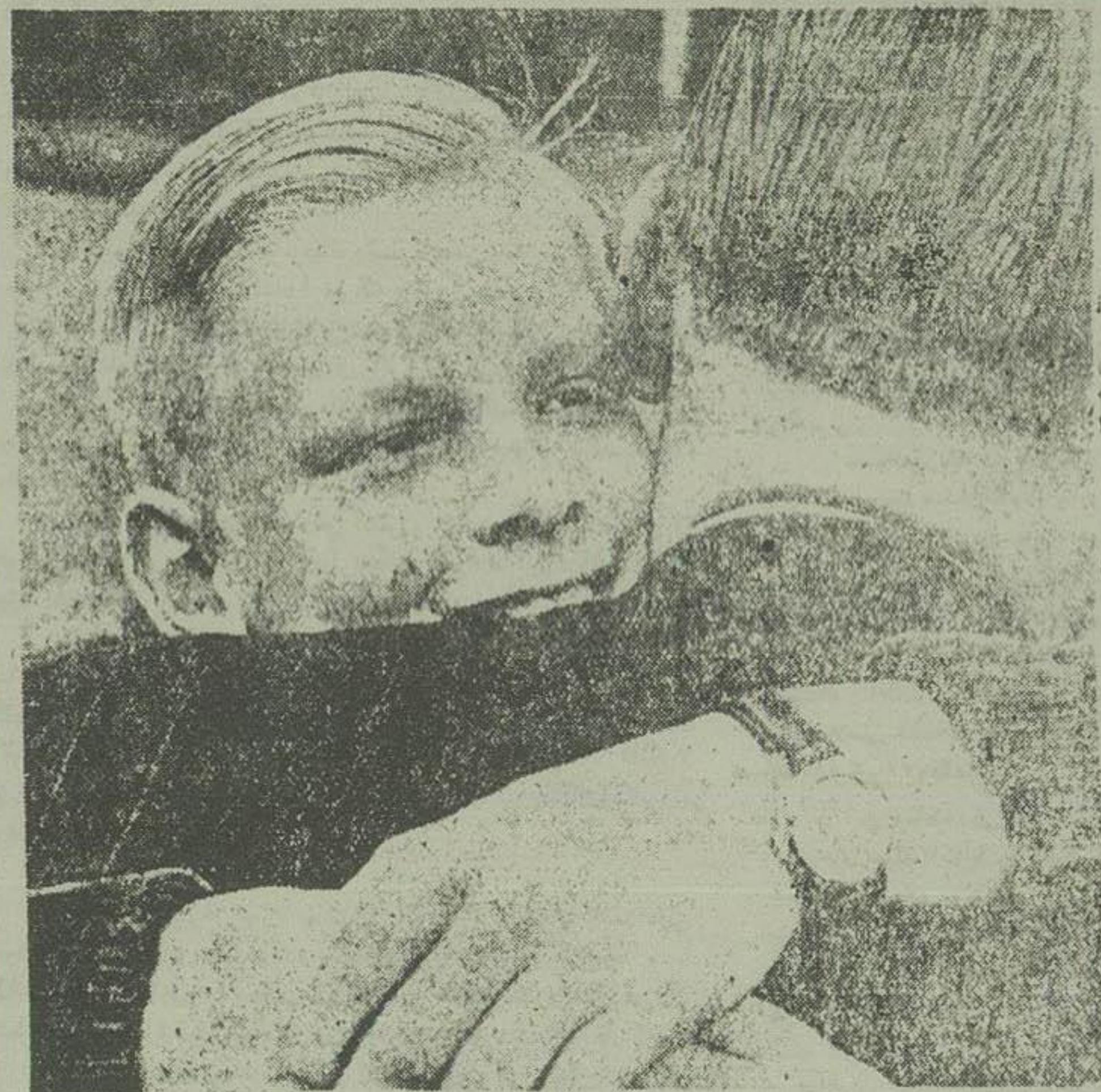
در اغوش پدر ۱۰۰۰

تعلق و چایولوسی خاصیت سکه فلبراد دارد . بدست هر کس برسد بیچاره و ورشکستی میکند.