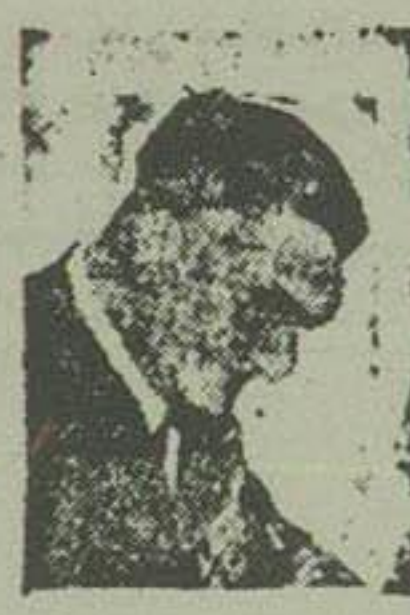
دریاسالار هونی نایب‌السلطنه سابق مجارستان

معدک فکر آزادیخواهی و استقلال طلبی از قزاق‌ها و مجاریها و بیرون رفتن روس‌ها پس از قیام کسوت برادرش طرفدارش علیه دولت اتریش سرور شد و در اثنای تیرماه امپراطور اتریش مجبور شد برای جلوگیری از تخریب امپراطوری خود، مجاریها را استقلال داخلی اعطاء کند. از آن تاریخ بعد امپراطوری اتریش نام امپراتوری اتریش متغییر معروف گردید.