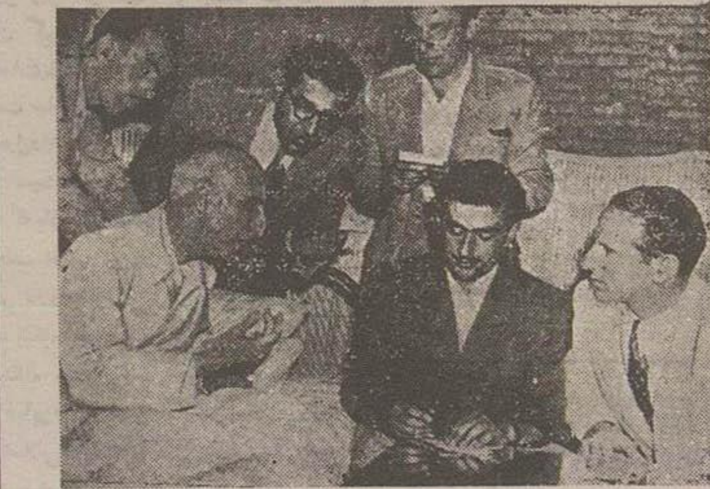
پس از قبول زمامداری خبرنگاران داخلی و خارجی در اطراف نخست وزیر اجتماع نموده و مصاحبه بعمل آوردند

تعداد آدانی که برای کاندیدای حزب لازم بود ۶۰۴ رای بود ژنرال ایزنهاور در این باره پیش از حد تصاب آورد. وقتی که ژنرال ایزنهاور اکثریت آراء را حاکم شد سناتور «بریکر» رئیس هیئت نمایندگان اوهاو اظهار داشت که سانتو تافت اطمینان میدهد بقیه در صحنه سوم