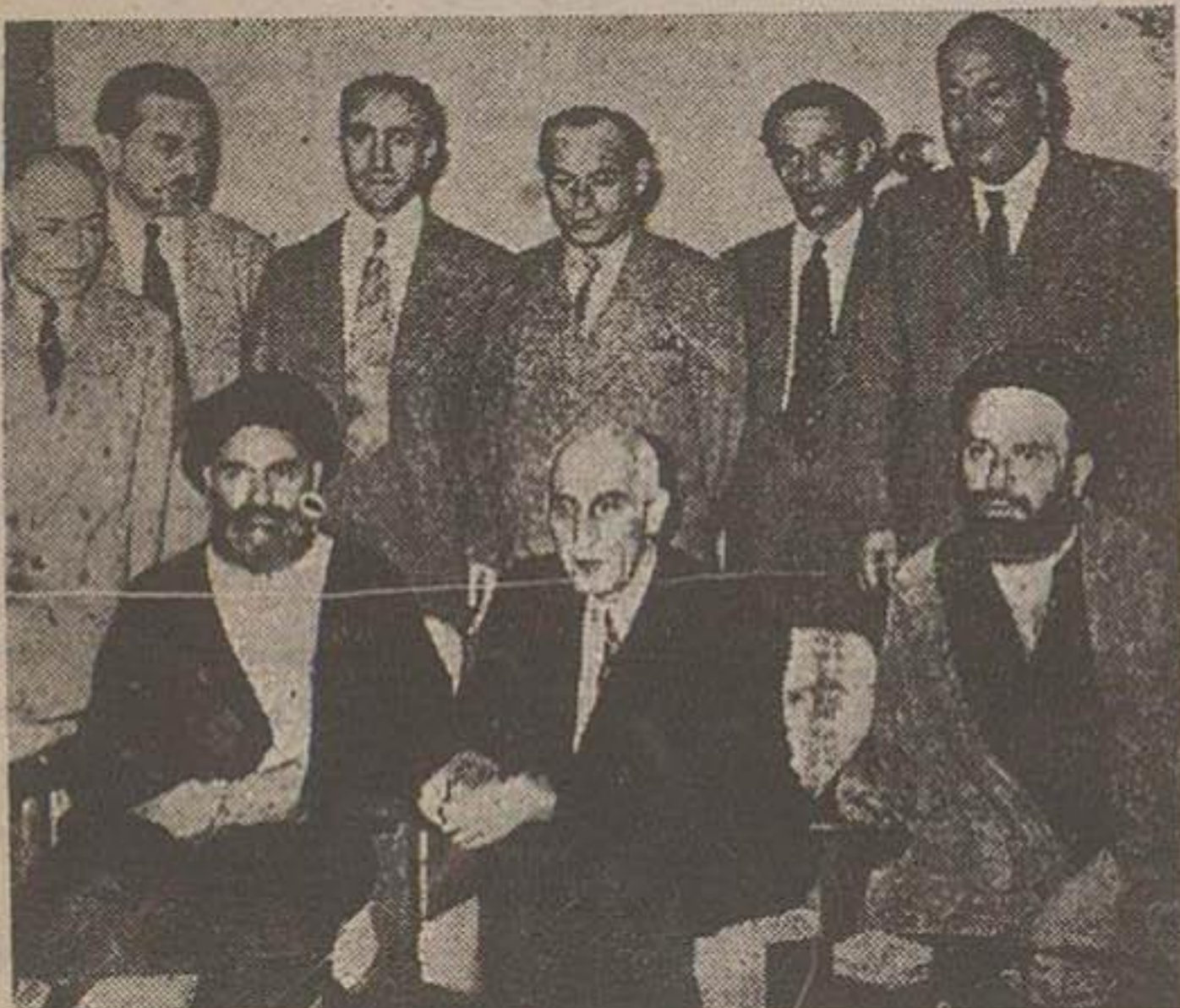
آقای دکترو مصدق پس از مذاکره با اعضای هیئت منتهی مجلس شورای ملی قبول زمامداری کرد

نخست وزیر فردا در جلسه خصوصی شورای امون بر نامه خود دما گراتی خواهد کرد ۱۸ تن نمایندگان منتخب مجلس شورای ملی، شب جمعه با دکترو مصدق ملاقات و در باب زمامداری مجدد وی مذاکره کردند مندرجات روزنامه ها از نظر دکترو مصدق