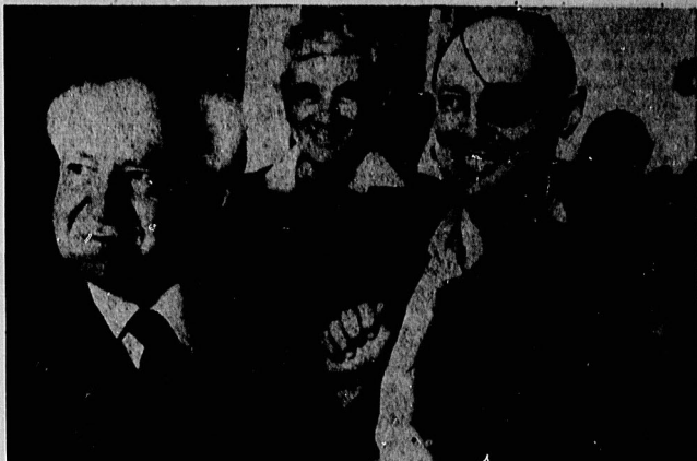
دو گروهی که در این نشست وزیر اسرائیل که خیره‌پناخ‌گزار اصلی سازمان امنیت اسرائیل است، در کنار جنرال‌ها دیده می‌شوند.

وظایف موساد وظیفه‌ی که موساد به‌عده دارد عبارتند از: جاسوسی، آدم‌ربایی، اسلحه‌فروشی، تهیه نقشه برای توطئه و کارهای خرابکارانه و ترور، بویژه ترور دیپلمات‌ها، در بسیاری از کشورهای جهان موساد در زمینه‌های زیر فعالیت می‌نماید: الف - اداره شبکه‌های جاسوسی ب - تهیه و عضوگیری عناصر سرسپرده و میزور در سایر نقاط جهان و تقویت آنها برای بدست آوردن اطلاعات سری ج - اداره شبکه‌های اطلاعاتی و وظیفه‌های امنیتی و تحقیق و جمع‌آوری منابع اطلاعاتی برای قیام شدت‌ناپذیر و حاد و مطالبات اکادمیک و استراتژیک است. تأکید بر صورت اطلاعات کافی و دقیق در مورد وضع سیاسی و اقتصادی و اجتماعی کشورهای مختلف جهان بویژه جهان عرب بدست آید. د - اداره شبکه عملیات سری که ویژه کار تصفیه و تعقیب و ضبط ترانزاکشن‌های است که با سهولت‌نهایی‌های ترور و ترور است. اهداف عملیاتی و مخالفت می‌کند. ه - اداره عملیات برای آموزش میزوران و جاسوسان جهت ارتباطی که بین سازمان‌های فوق و نخست‌وزیر و سردار در کارهای سری.