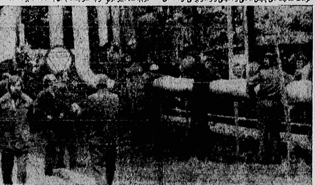
دنیای کمونیسم اینک در لهستان با یک «طبقه کارگر» واقعی مواجه است

حرکت کریم، در حدود ساعت ده صبح در یک گوشه خلوت در کنار نهر آبی به بنای رسیده که در داخل یک چادر و آفتابگردان‌ها برای کم‌کم در پیوند این نوح چادرها شکل دور ساخته شده که پشتیبان‌های فصل برای استفاده از تابش آفتاب و یا جلوگیری از آن استفاده می‌شود. در داخل چادر، روزی‌روزی صحنه‌های حرفه‌ای و چینی توشیه می‌که با آن کمی گرم شده و بدان امیدهای باغ بهترین دوست بشر در سرما و گرمات: خانه‌های روستایی بعد از اینکه اسبهای همراهان ما نیز خسته شدند، سنگی حرکت کرده و تا نزدیک راه پیمودیم. شش‌رازی در یک خانه روستایی که قبلاً رختخوابی برای ما مهیا کرده و روی زمین گسترده بودند، پرسیدیم. از موقعی که من به آن‌ها وارد شدم، تا زمانیکه از این ملکات خارج گردیدم - همیشه - چه در منزل و چه در جاده - روی زمین می‌خوابیدم، چون درازنیم که روی سنگ‌ها در سراسر ملکات است. که من از طرف عدم مصرتیت در مقابل تیش تیرب و هزارها و رطوبت و آبریز دیگری ندارم. از آن‌ها صاف در برابر این‌گونه مهمان‌نواختانه معمولاً روستاهای اصیل اطراف من صحبتی در پیش می‌گیرند. ملا من که زن جوان خارجی و بی‌مشماسه که شبها یک کشتی از این‌گونه دست می‌گیرند و می‌خواهند تاد صورت لزوم آماده نشین این‌گونه مهمان‌ها باشد. رختخوابها را برآوردیم روز معمولاً در بچه‌های (۱۱) لپیچه، روی آن‌ها پانچ‌ها آبریشی ژورق دیرین داری می‌پوشانند تا در