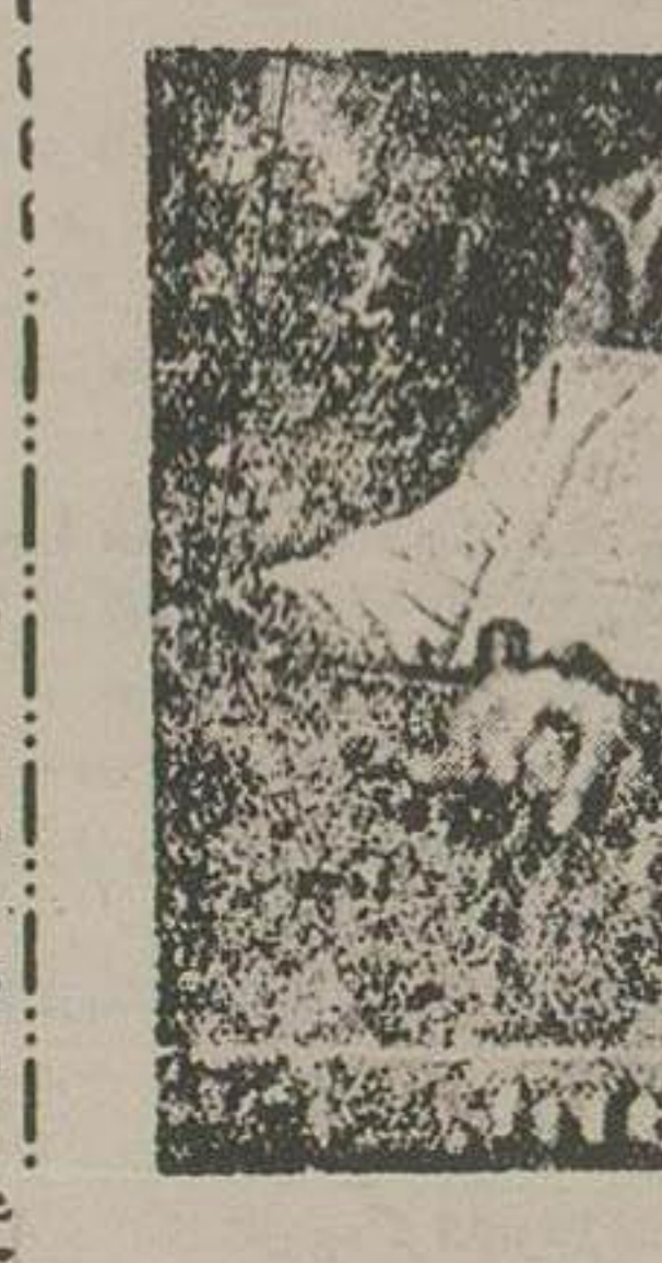
لحظه حساس از فیلم پرواز خطرناک

هنگامی که چنین جریانی در یک کوه هواپیما جریان دارد در گوشه دیگر آن دختر و پسری که بنازگی از دواج کرده اند و ماه عمل خود را نیز گذرانده اند لیکن هنوز در تب عشق یکدیگر میسوزند دروازه آنهمه جا در جنجال برانگیخته میشوند و گوئی در عالم دیگری بسر میبرند در همین هنگام ناگهان یکی از موتورهای هواپیما خراب میشود و در تماشای شدیدی متوجه میگردند که هواپیما ناچار به فرود آمدن است.