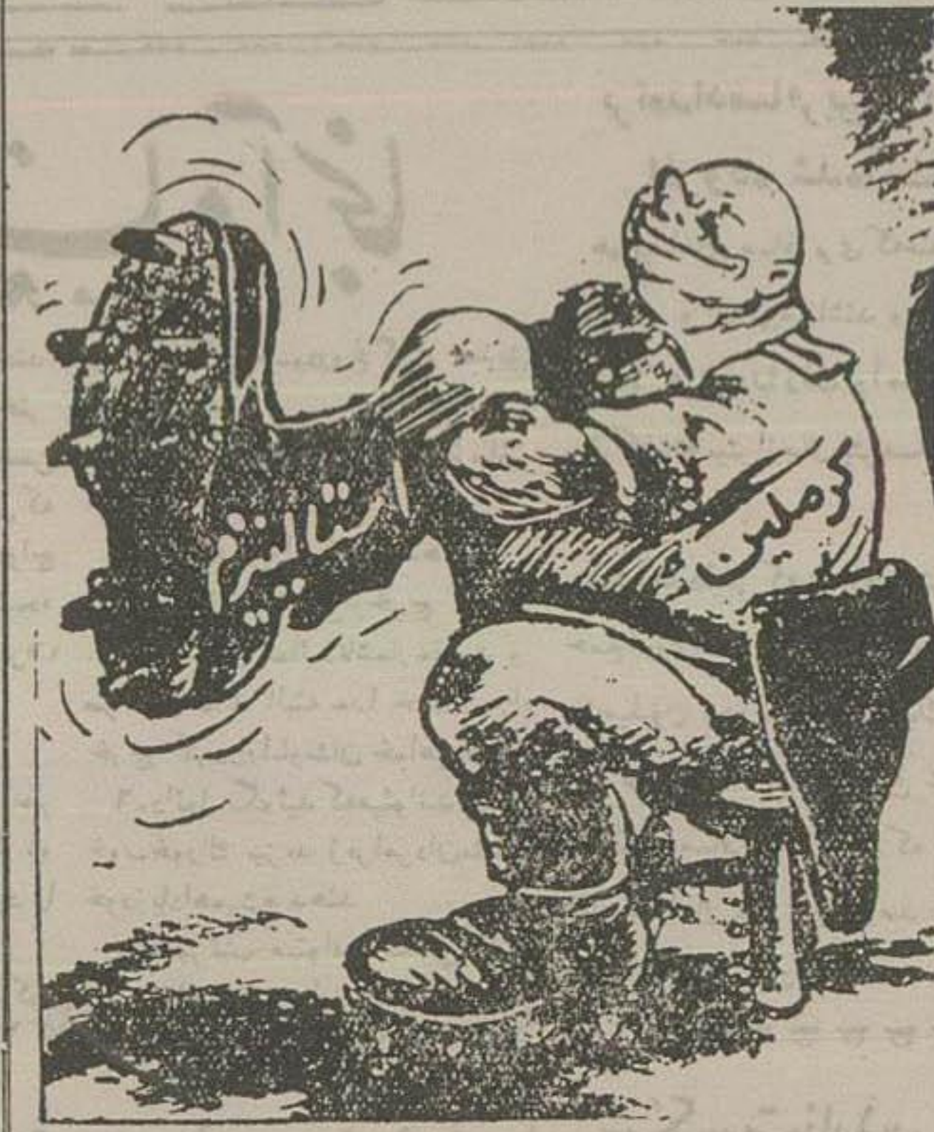
تحول کرملین از نظر یک روزنامه هندی

به نامبرده دستور داده بود تصرف ۲۴ تا کتون از ۱۰۶۶۰۰ نفر پناهنده ساعت خاک آن کشور را ترک گوید . اوارگان مجارستان بلا تکلیفند وین - خبرگزاری فرانسه - روز گذشته نیز ۳۶۰ نفر از پناهندهگان توسط سه هواپیمای بزرگ انگلیسی طرف انگلستان پرواز کردند تا در خانوادههای انگلیسی اقامت گزینند از طرف دیگر قرار است ۱۱ هواپیمای دیگر ۳۰۰۰ نفر از پناهندهگان را به انگلستان ببرد . پاریس - خبرگزاری فرانسه - نویسنده فرانسوی رومن کاری جایزه ادبی گنکور ۱۹۵۶ را با کتاب خود مرثیه های آسمان و ریبود های امریکای جنوبی اعزام خواهند شد.