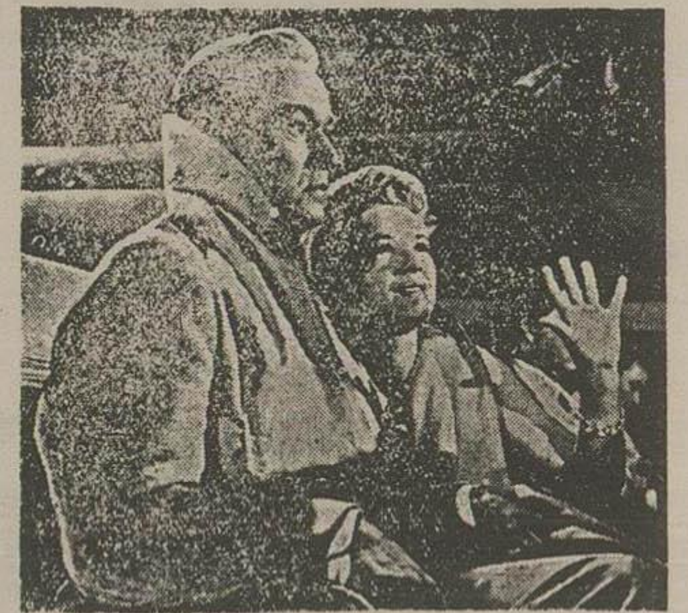
موقعی که بنزین هواپیما تمام شده است

امروز راجع به فیلمی به نام میکسم کسوزه آن از هر جهت تازه و بی سابقه است. این فیلم که از کتاب مشهور «ارنست که کان» تحت عنوان «The High and the Mighty» میسر به تعلق و مقتدره اقتباس گردیده و همین نام نیز برای پرده سینما آمده است. برای نخستین بار پرسوناژهای مختلف و متعددی را گرد هم جمع کرده راجع آنها بحث کرده است و ضمن تشریح روحیه این اشخاص در مقابل یکدیگر عکس العمل آنها را نیز در مقابل یکدیگر وضوح مشترک میسر کرده است. خلاصه داستان فیلم «پرواز خطرناک» بشرح زیر است: