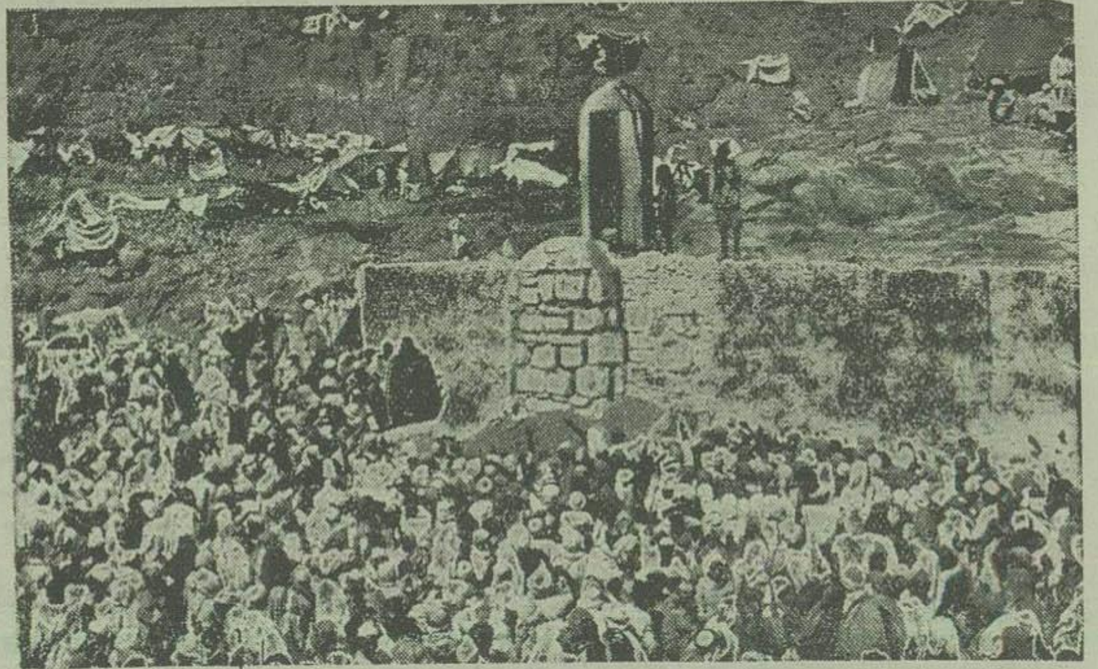
در عکس بالا حجاج در «مشعر الحرام» مشغول رمی جمره می باشند