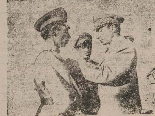
برادر مردان یکی از افسرانی که در حادثه جنوب مجروح شده است مقتضی بگرفتگی مدال میشود