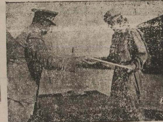
سرلشکر پنجون کوهی نامه خلبانی را بحضور ملوکانه تقدیم می نمایند

بعد از ظهر روز پنجشنبه ۲۵ مهرماه مراسم تقدیم گواهی نامه خلبانی به پیشگاه اعلیحضرت همایون شاهنشاهی در فرودگاه در شان تبه انجام گردید. آقای سپهبد احمدی وزیر جنگ - آقای سرلشکر رزم آرا رئیس ستاد ارتش و وابسته های نظامی انگلستان - روسیه شوروی - فرانسه - بزرگ و سایر افسران ارشد ارتش و کادر افسران بیرونی هوایی در این مراسم حضور داشتند. در دقیقه ۱۵ ساعت که یک هواپیمای جنگی ادا کس دارای شماره ۴۴۲ بر فراز فرودگاه دوشان تبه په نیودار شد. این هواپیمای شاه بود که از