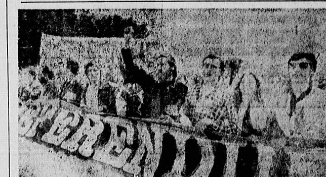
ماریه - اسپانیا - ۴ اکتبر ۱۹۸۱ - چندین آزادیخواه اسپانیایی روز یکشنبه در مرکز ماریه در اعتراض به ورود اسپانیایی بهاتو رامبلیین کردند.

تونس - خبرگزاری تونس - رهبران اسلامی تونس به ۱۰ تا ۱۵ سال زندان محکوم شدند.