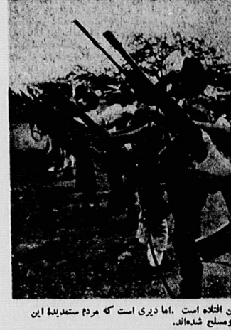
آمریکا بکر صحنه گردن دیکتاتورهای آمریکای لاتین افغانه است. ماوری است که مردم مستبدانه این منطقه در برابر دشمن مشترکشان، یعنی آمریکا متحد و موصلند شده‌اند.

تحقیق می‌کنند و در نتیجه از... دولت ریگان قصد دارد شمار بیشتری از کشورهای آمریکای لاتین را در صحنه ناآرامیهای منطقه شرکت دهد.