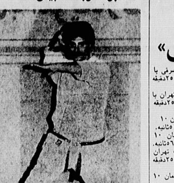
دعوت از کارخانسان فوتبال... دعوت از کارخانسان فوتبال.