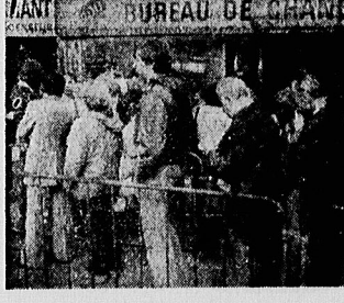
پاریس - ۴ اکتبر ۱۹۸۱ - پاریسیها و جهانگردان در استانه راه آهن شمالی غرب فرانسه در برابر یک صرافی صف بستند.