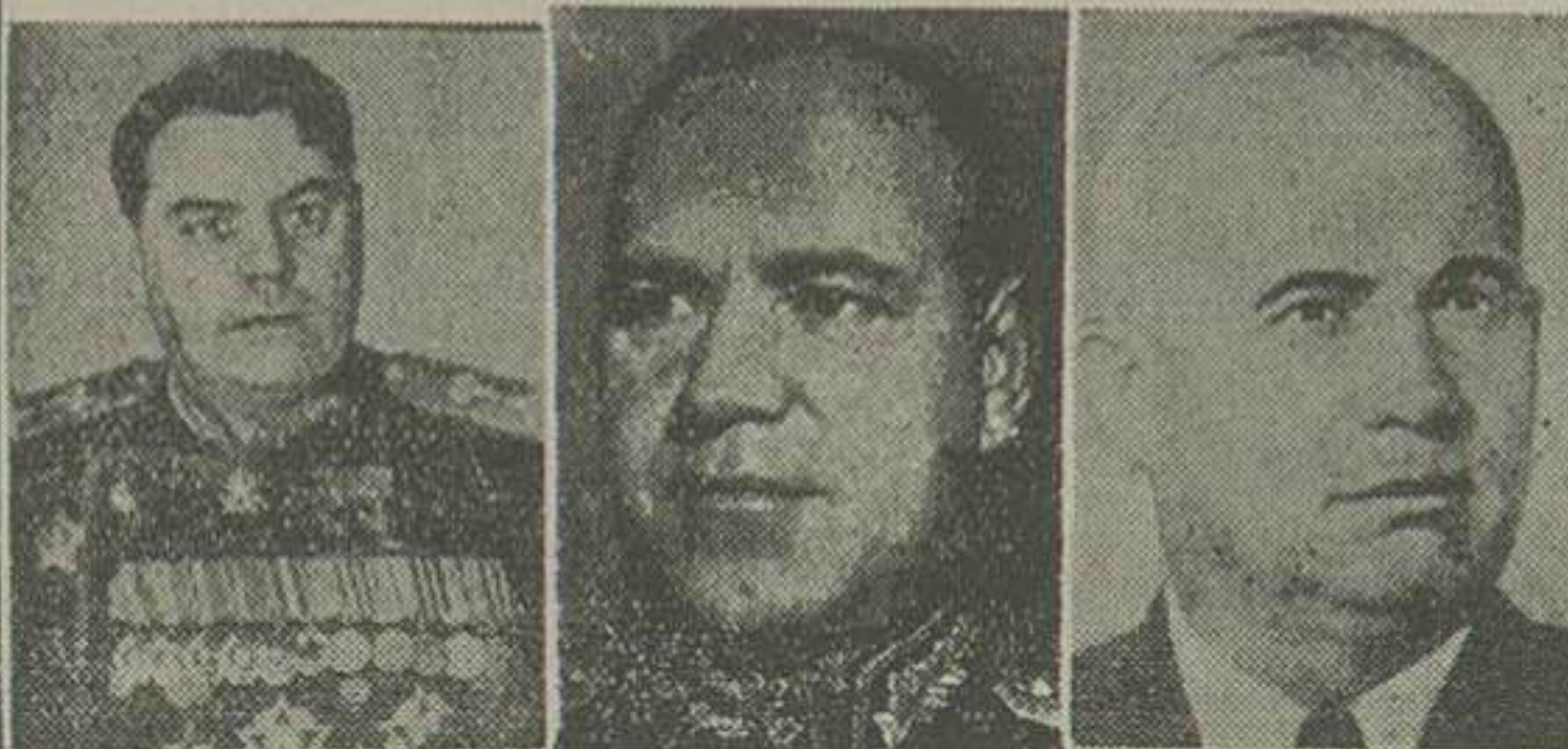
خروشچف، ژوکف، سوکولوف

پسر رهبر فقید شوروی را به علت همدستی با بریا از بین برده است