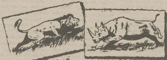
نیرومند مانند شیر