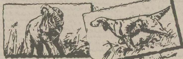
عزیز و نامزد