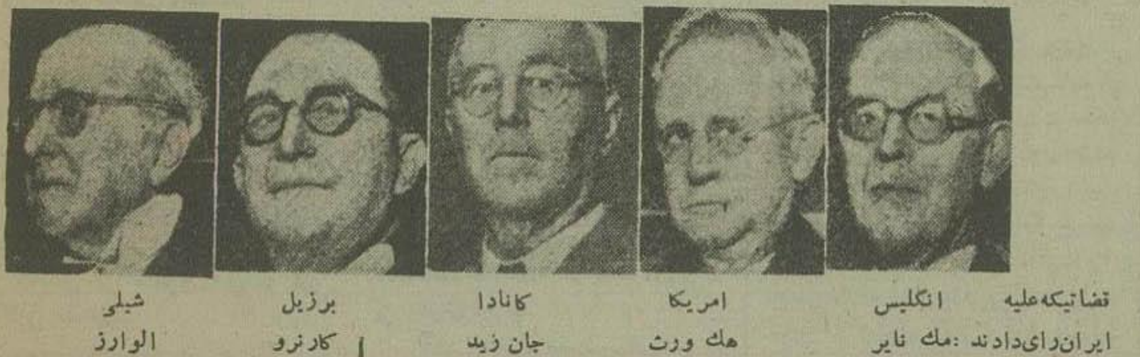
قضاتیکه علیه ایران رای دادند: مک نایر / امریکا: مک ورت / کانادا: جان زید / نروژ: کلانو / شیلی: الوارز

خواهندگان عزیز اطلاع دارند که دادگاه بین المللی لاهه در تاریخ نهم ژوئن مطابق با نوزدهم خرداد ماه ۱۳۳۱ جلسه تاریخی خود را برای رسیدگی باختلاف ایران و انگلستان بر سر مسئله نفت در کاخ صلح لاهه رسماً تشکیل داد. آقای دکتر مصدق نخست وزیر ایران که با تفاق عده ای از اعضا و نمایندگان ایران برای دفاع از حقوق حق ایران بلاهه عزیت کرده بودند در جلسه اول دادگاه نطق مرسوم ایراد کرده و از حقوق ایران دفاع نمودند. پس از نطق آقای دکتر مصدق پروفیسور هنری رولن سناتور بلژیکی بقیه در صفحه سوم