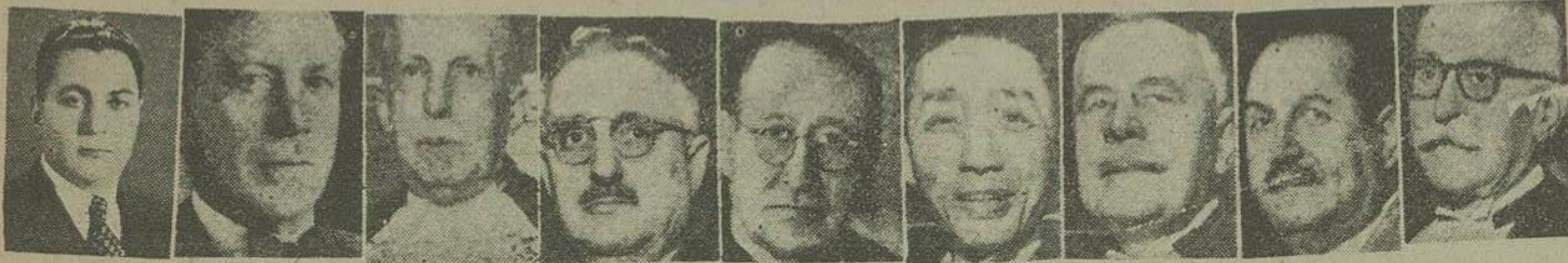
قضاتیکه موافق ایران اند

قضات فرانسه، مصر، لهستان، نروژ، یوگوسلاوی، ساوودور، چین ملی، اروگوئه، ایران بِنفع ایران و قضات امریکا، انگلیس، کانادا، شیلی، نرژیل بضرر ایران رای دادند و قضات شوروی و هندوستان در دادن رای شرکت نکردند لاهه - آسوشیتد پرس - دیوان داوری بین المللی لاهه روز سه شنبه رای داد که صلاحیت تقاضات در اختلاف نفت بین ایران و انگلستان را ندارد این اظهار نظر با رای موافق و پنج رای مخالف صادر گردیده ایران از رذائل منکر صلاحیت دیوان برای تقاضات در اختلاف نفت بود.