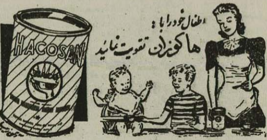
مطلوب خود را به ما کزین تقویت نماید