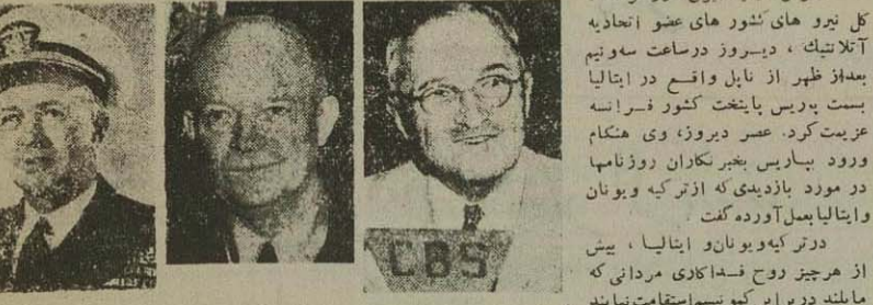
ایزن هاور، ترومن، ایزن هاور

یک سوم درآمد غیر خالص ملت شوروی صرف امور نظامی میشود - کشورهای عضو اتلانتیک ۸ درصد و امریکا ۱۵ درصد در آمد خود را صرف اجرای برنامه های نظامی میکنند