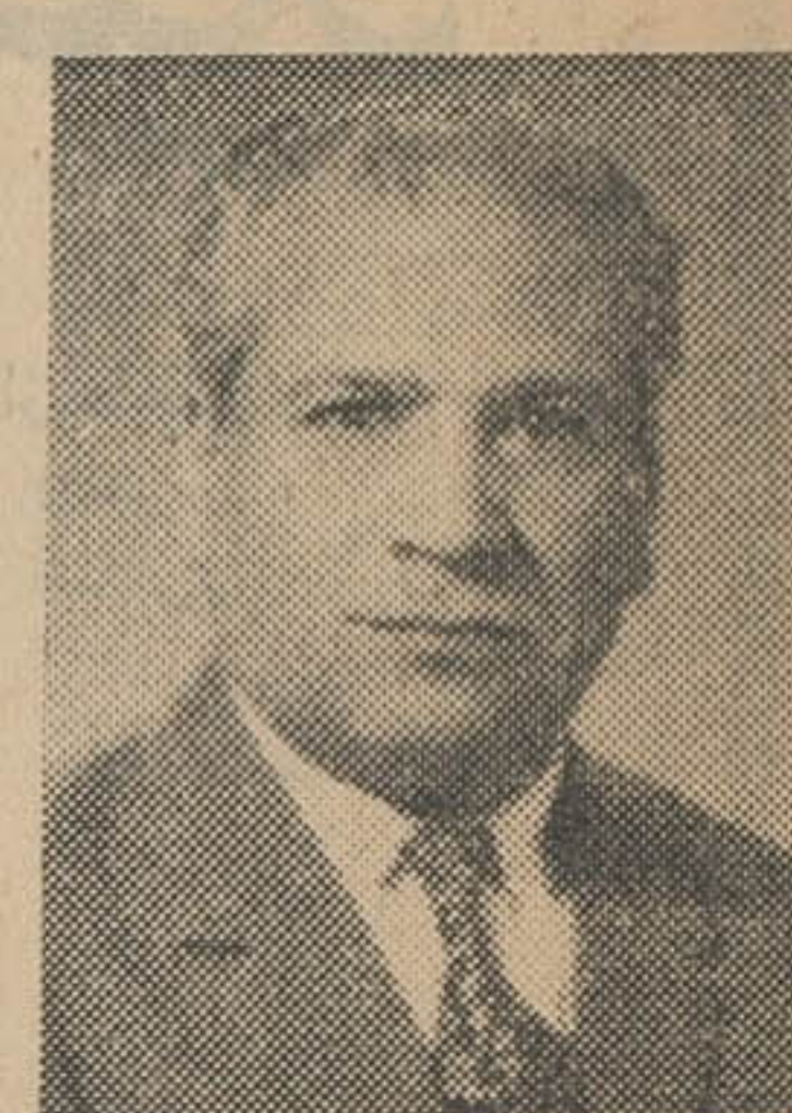
دکتر در تاریخ

جبهه ترقیخواهان ایران از جامعه روحانیت و پیشوایان مذهبی نیز استمداد دکتر در تاریخ