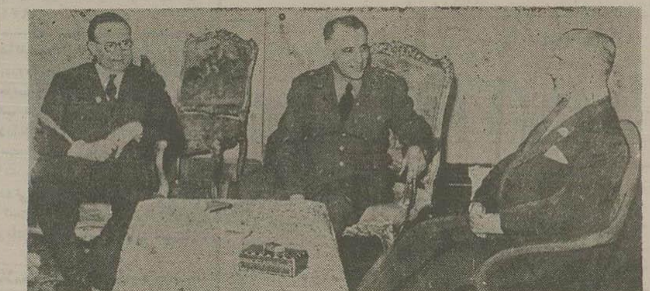
درعکس بالا آقای هندرسن سفیر کبیر آمریکا در ملاقات امروز با تیسار سپهبد زاهدی نخست وزیر و آقای انتظام وزیر امور خارجه دیده میشوند

چون موعده بهره برداری از صنایع نفت آبادان نزدیک شده و از روز شنبه دوره قانونی شروع میشود. امروز خبر نگار ما در خصوص نحوه استفاده از عواید نفتی تحقیقات بیشتری بعمل آورد. یکی از اعضای مسئول سازمان برنامه اطلاع داد که سازمان مزبور رسماً مسئول استفاده از این درآمد شناخته شده است و تمام مبلغی را که کنسرسیوم میپردازد بصرف میرساند متصدیان امور مالی در وزارت دارائی اظهار می کنند که چون باید بهر طریق که ممکن است هزینه های جاری تامین شود و این مخارج مقدم بر سایر مخارج می باشد باین جهت موافقت شده است که قسمتی از درآمد نفت برای جبران کسر بودجه بصرف برسد ولی مسلمان این مبلغ نسبت بیولی که در هر سال از نفت عاید می گردد قابل ملاحظه نیست.