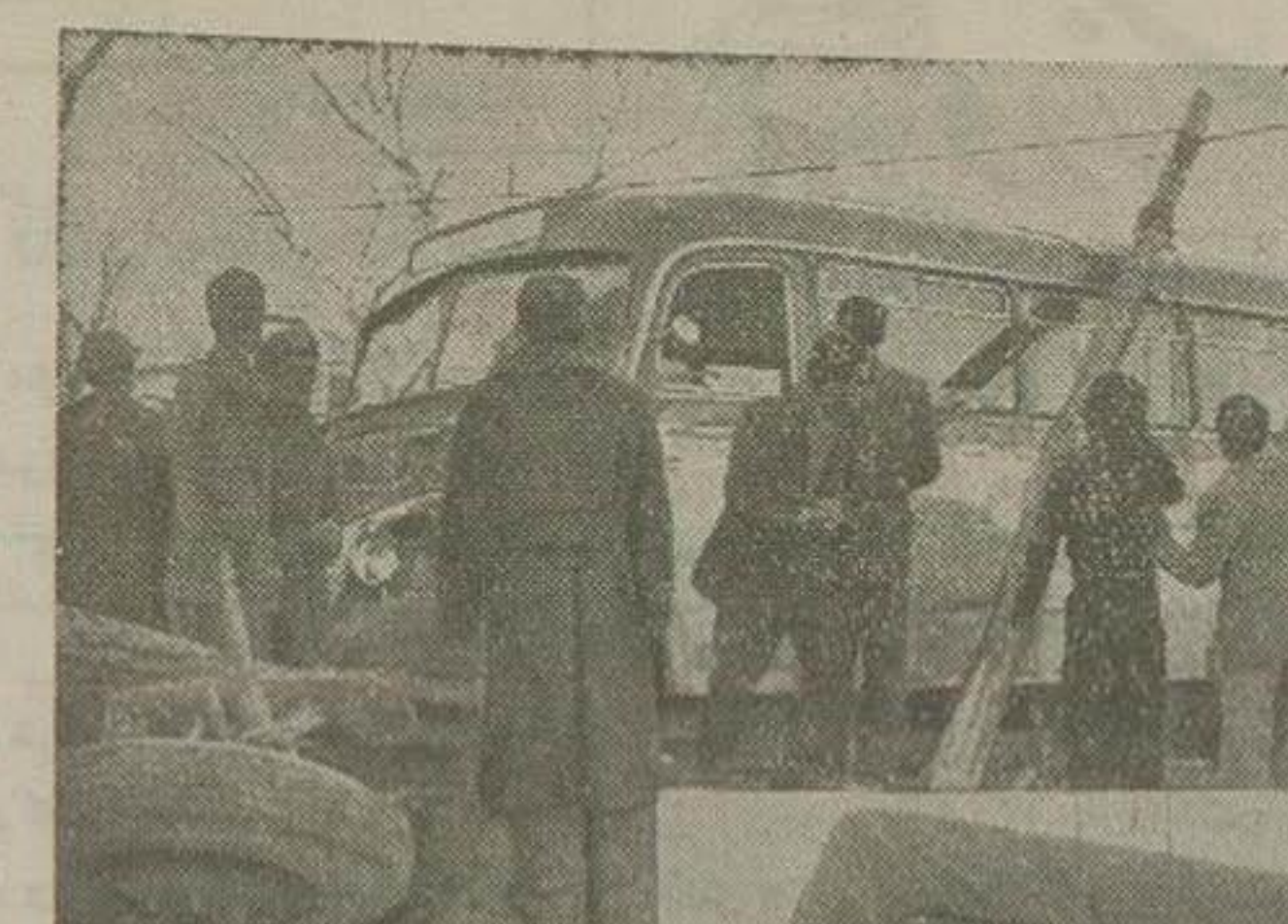
ساعت شش و نیم صبح امروز یک کامیون ارتشی بایک اتوبوس مرسدس بنز خط ۱۱ فرعی شدت بهم برخورد کرد که صدای آن کلیه ساکنین اطراف را تکران و متوحش ساخت

بقر اطلاق، راننده کامیون ارتشی که یک نفر گروهبان بوده بسرعت حرکت میکرد و غفلتانه در چهارراه تخت جیشیدر خیابان روزولت مقابل باغ سفارت کبرای امریکا با اتوبوس مزبور تصادف مینماید شدت تصادف بعدی بود که چرخهای جلوی کامیون از پدنه کامیون جدا شد و بسافتی دوبرتاب گردید و اتوبوس نیز از جاده بسمت پیاده و متعترف گردید و بادیوار شدت تصادف نمود که در نتیجه بقست جلوی آن خسارت و صدمه زیاد وارد آمد.