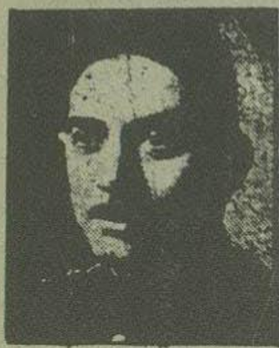
آقای نوری سعید پاشا

می باشد که از خلیج فارس تا لوه دولا بمارمند گردیده و در آنجا بامر حذر که اتصال پیدا کرده و طول آن تقریبا ۱۲۷۰۰ کیلومتر می باشد در تمام طول سرحد بین عراق و ایران اهالی باستانی بعضی غلط کوچک اغلب مرکب از مردمان بدوی و چادر نشین میباشند و تا چند سال اخیر دولت در این نواحی یک تقبش محدودی بعمل آورده و در بعضی نقاط عملا هیچ تقبش صورت نمی گرفت و در نواحی دیگر بواسطه وضعیت طبیعی مملکت و اهالی سرحدی ارتباطات خیلی بطی و دشوار بود برای اینکه بتوان بشوق طولانی و اشکالات مهم که در ایام گذشته مانع از تجدید حدود سرحدی در محل گردیده می بود لازم است این قضایا را در نظر گرفت